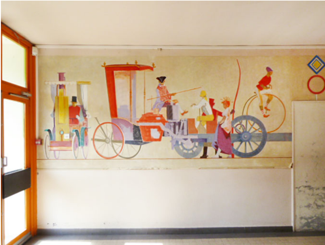
Vue d'un fragment de panneau aujourd'hui détruit.