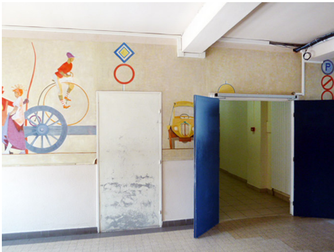
Vue d'un fragment de panneau aujourd'hui détruit.