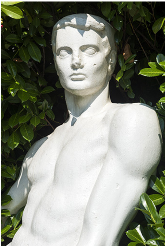
Détail : torse.