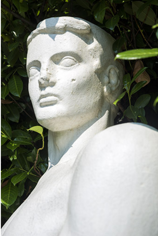
Détail : la face.