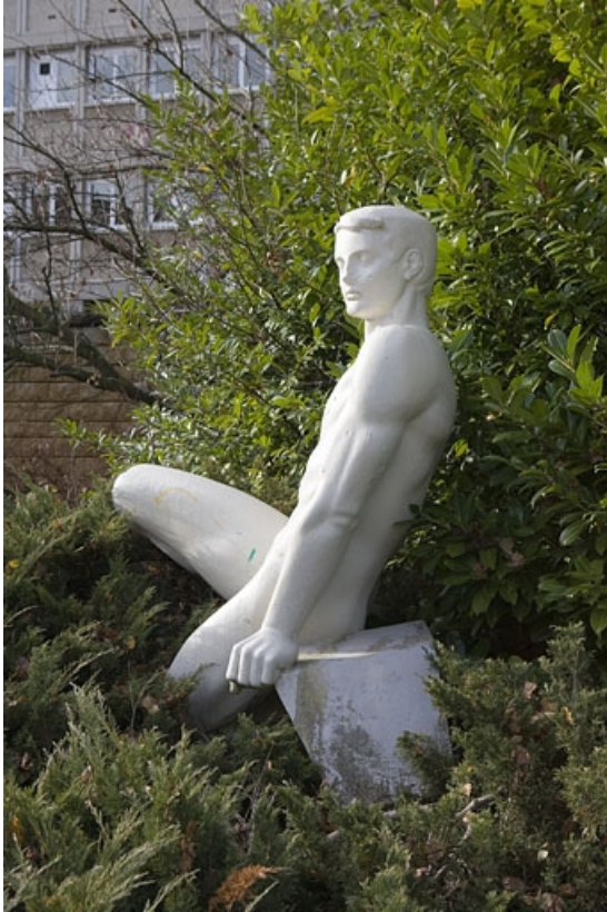
Ancienne entrée. Statue d'un jeune homme nu de Lagriffoul.