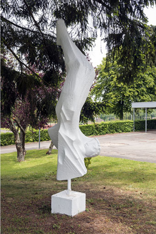
Ouvre d'Oudot : vue sur la face. 25, Bethoncourt impasse Camus