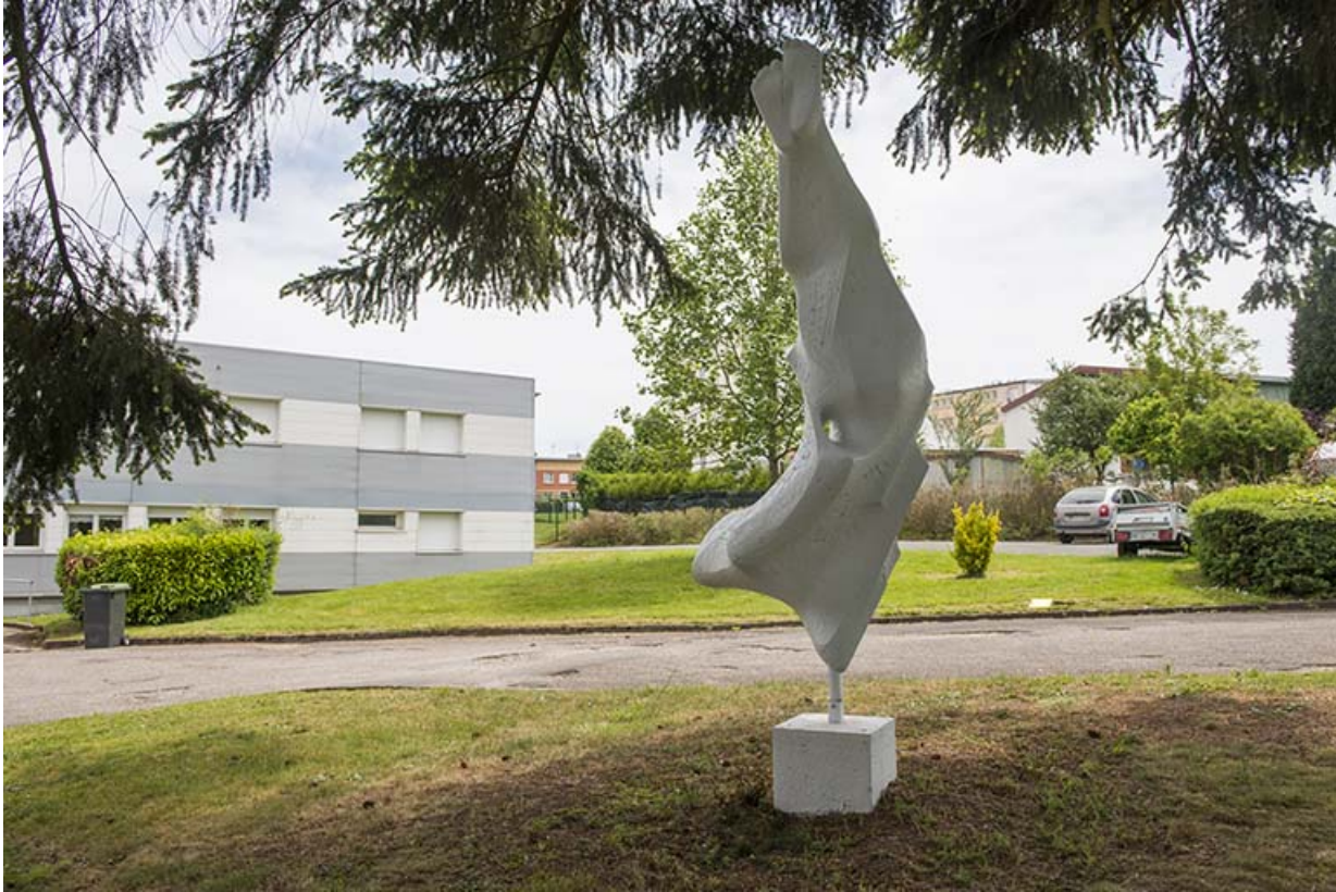
L'oeuvre dans son site : face postérieure. 25, Bethoncourt impasse Camus