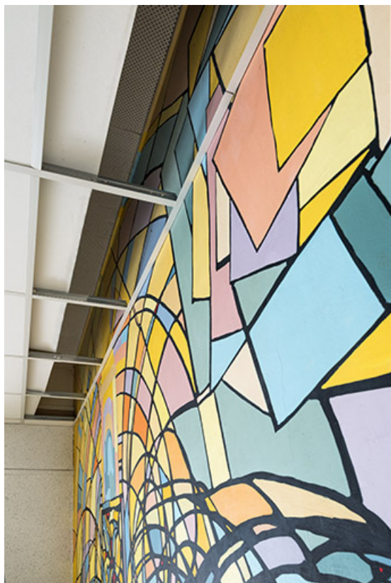
Détail des parties masquées par le faux-plafond.

25, Montbéliard, 8 avenue de Lattre de Tassigny