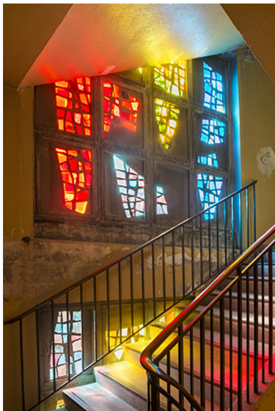
Vue du troisième niveau.