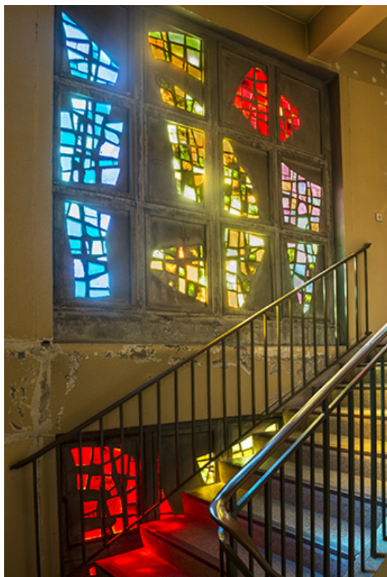
Vue du cinquième niveau.