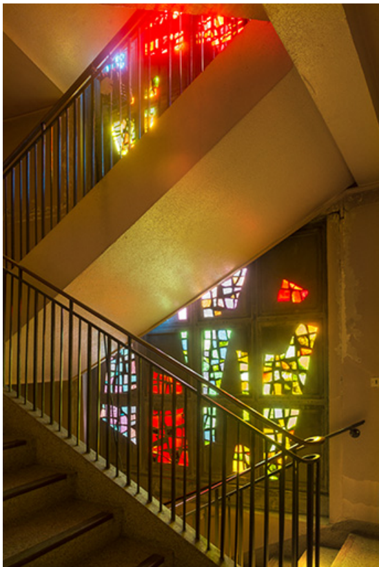
Vue du premier niveau.