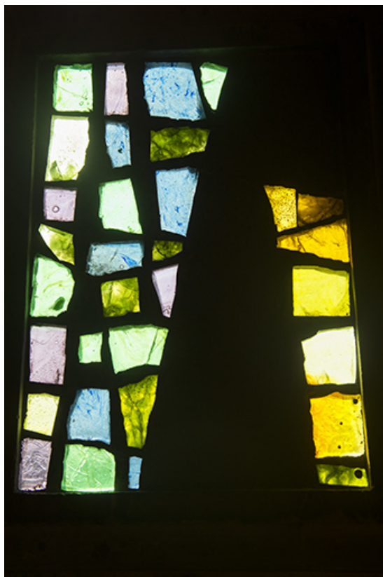
Détail de la verrière du premier niveau.