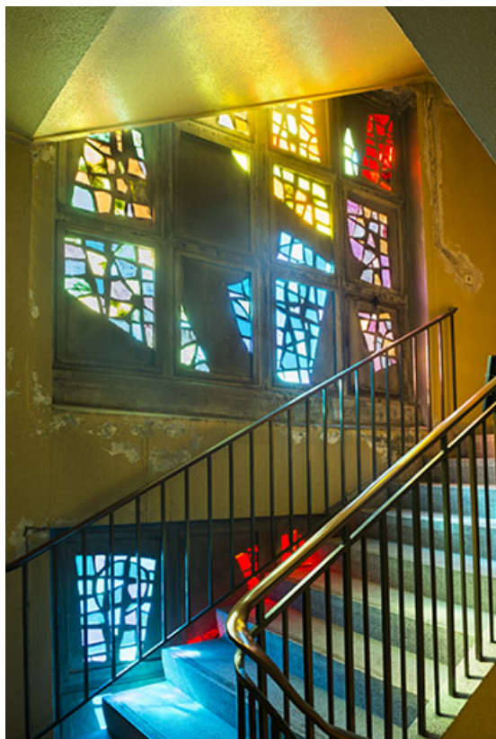
Vue du deuxième niveau.