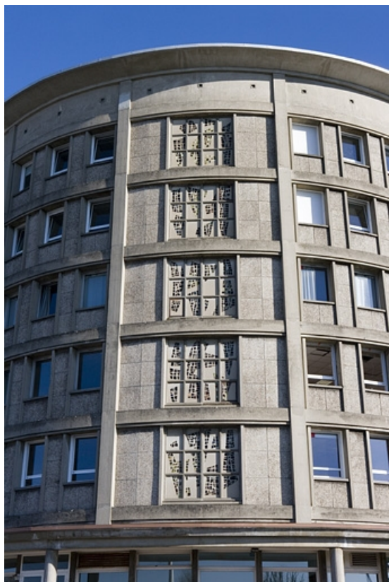
Bâtiment D. Tour internat. Détail vitrail.