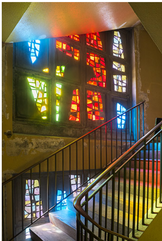
Vue du quatrième niveau.