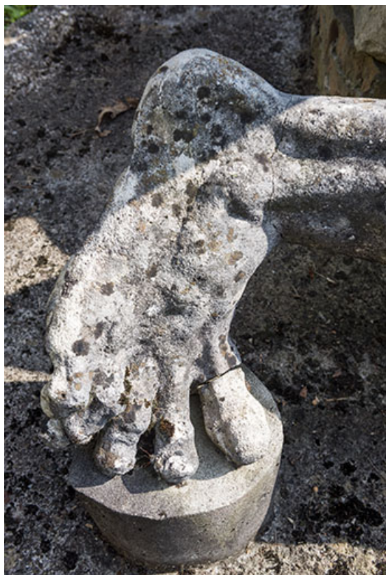
Vue de détail : le pied.