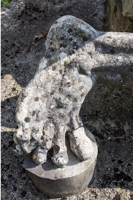
Vue de détail : le pied.