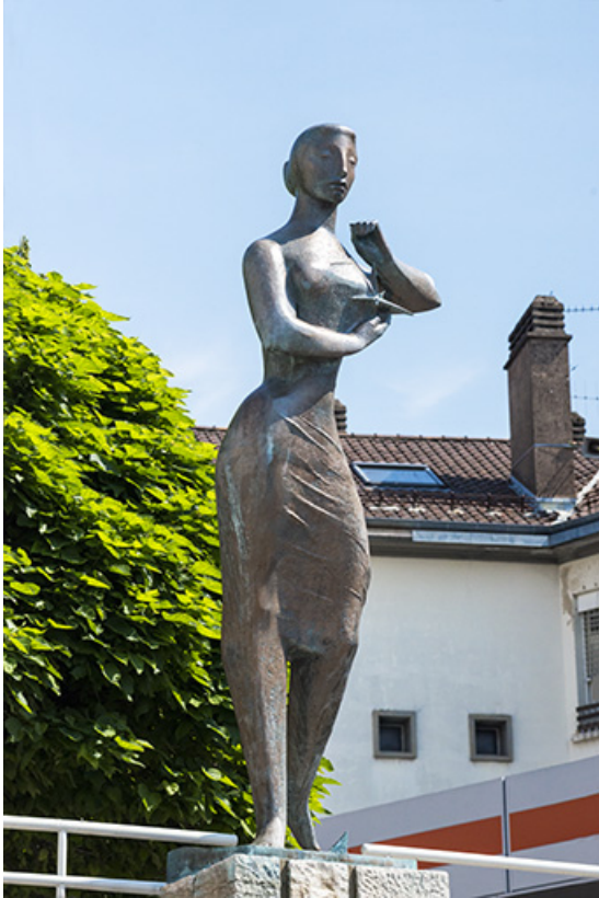
Sculpture de Georges Oudot intitulée La messagère de l'esprit, dite "Simone", dite Mlle Félix, vue de trois quart ouest. 25, Besançon, 25 avenue Commandant Marceau