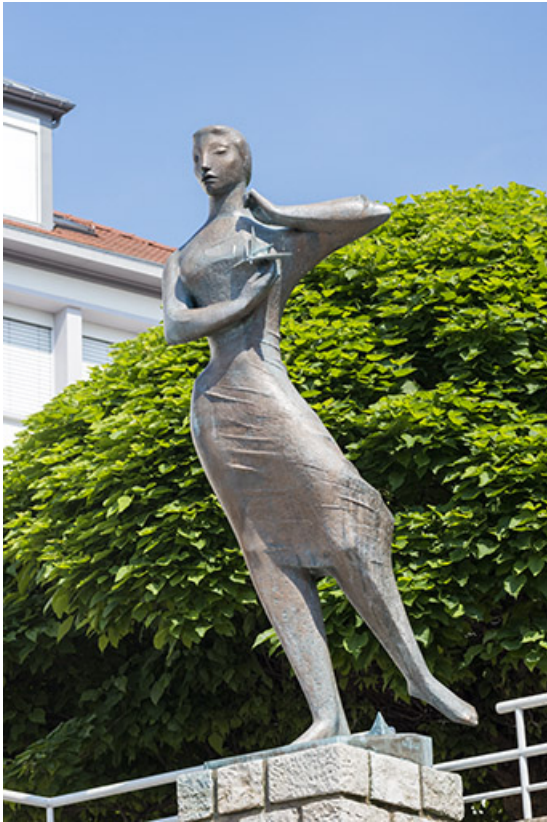
Sculpture de Georges Oudot intitulée La messagère de l'esprit, dite "Simone", dite Mlle Félix, vue de trois quart est. 25, Besançon, 25 avenue Commandant Marceau