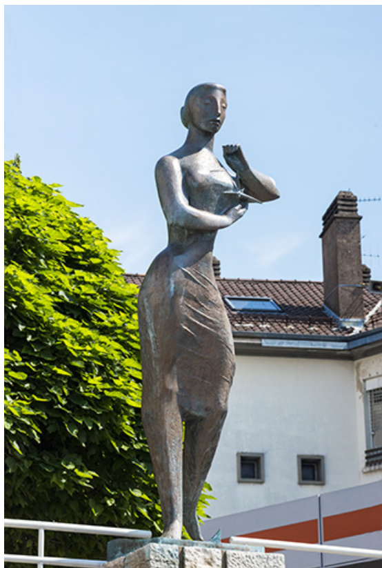
Sculpture de Georges Oudot intitulée La messagère de l'esprit, dite "Simone", dite Mlle Félix, vue de trois quart ouest. 25, Besançon, 25 avenue Commandant Marceau