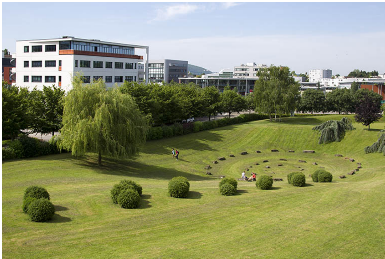
Vue partielle sur l'installation paysagère, depuis le nord-est.

25, Besançon, 14 rue Alain Savary, lieudit : Temis