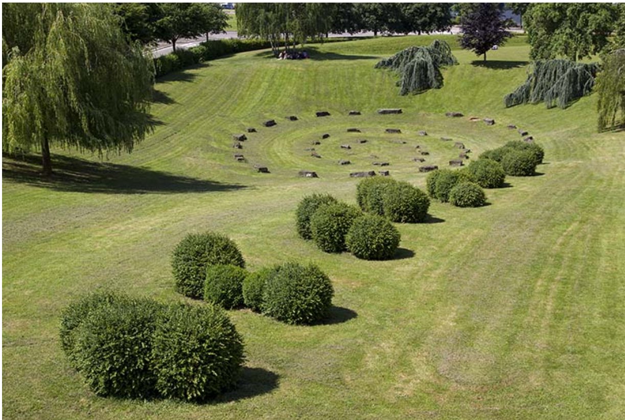
Vue partielle de l'installation paysagère depuis le nord-est.