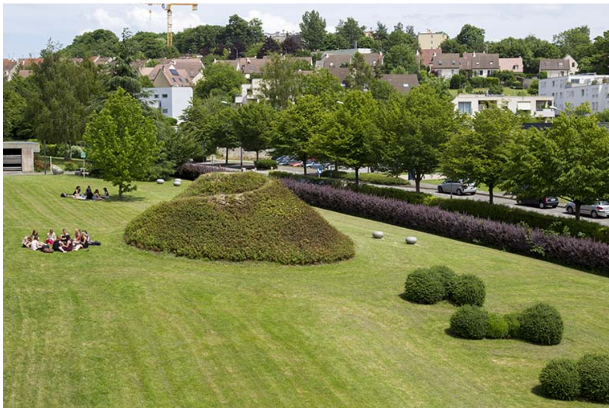
Vue partielle de l'installation paysagère depuis le sud-ouest.