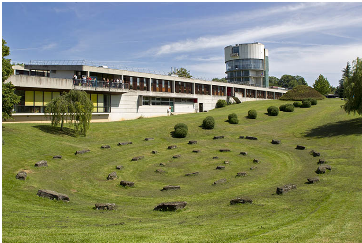
Vue partielle sur l'installation paysagère et les façades antérieures depuis le sud-ouest.

25, Besançon, 14 rue Alain Savary, lieudit : Temis