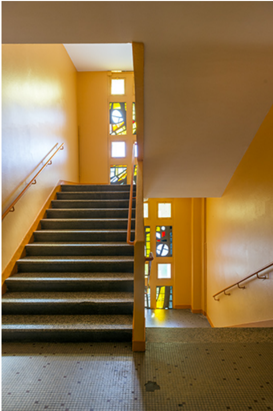
Escalier de l'externat : vitraux de Wogensky.

25, Besançon, 91, 93 boulevard Léon Blum, lieudit : Palente