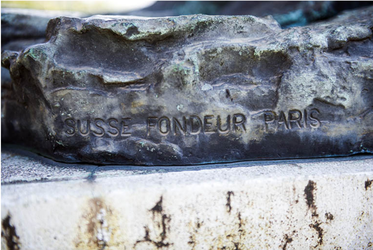
Détail : signature du fondeur.