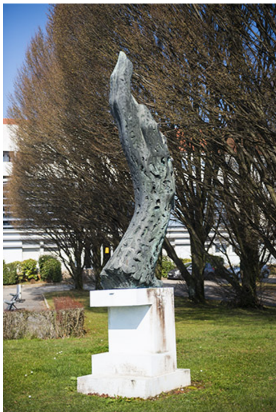
vue d'ensemble de profil.