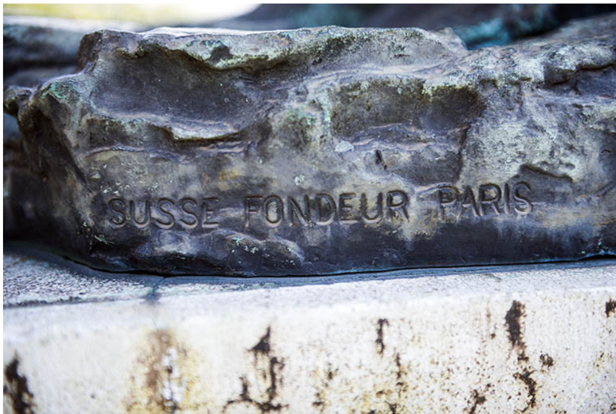
Détail : signature du fondeur.