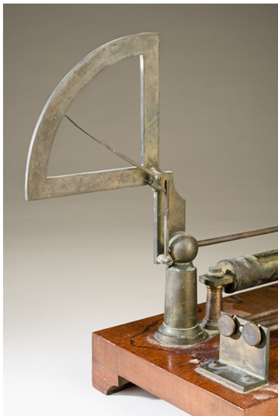
Levier, aiguille et cadran.