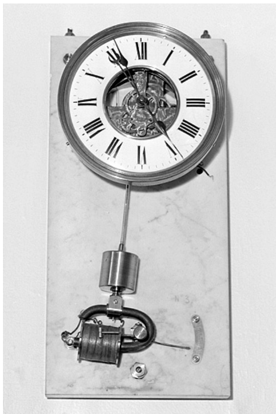
Vue d'ensemble, cage ôtée.