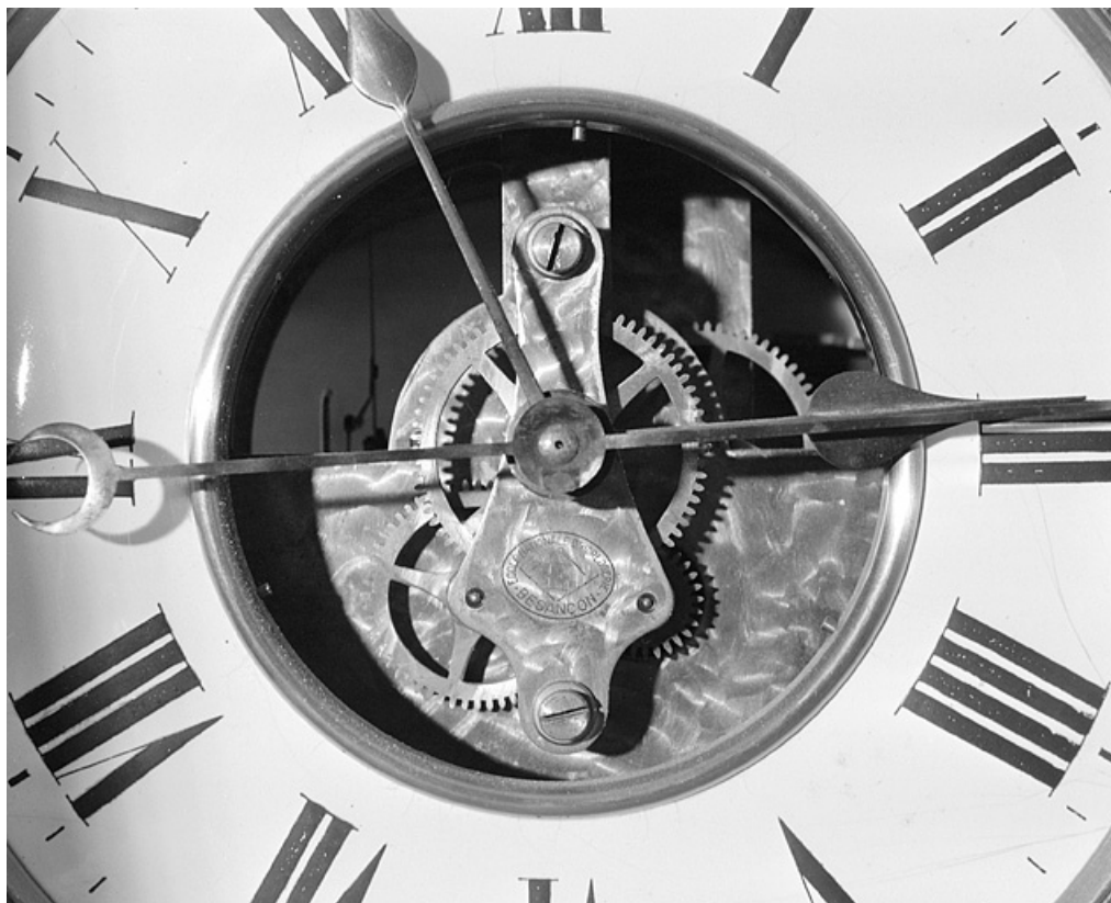
Aiguilles et logotype de l'école.