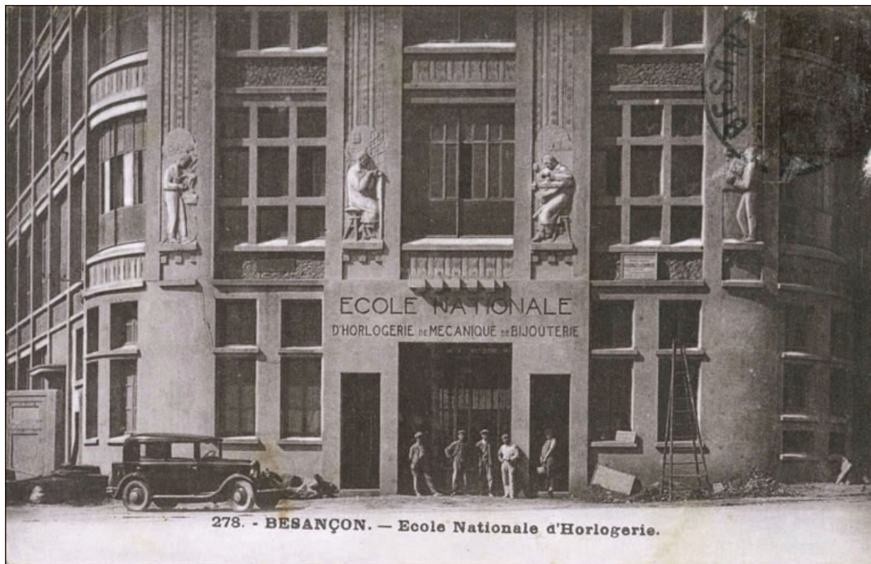
Besançon. - Ecole Nationale d'Horlogerie [l'entrée, avec des ouvriers], 1931 ou 1932.