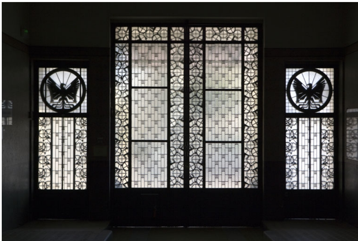
Vue d'ensemble, depuis le passage couvert.