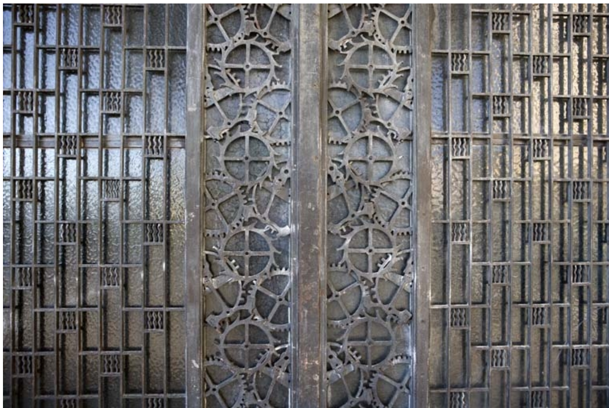
Porte centrale : motifs décoratifs à la jonction des vantaux (vue horizontale). 25, Besançon, 1 rue Labbé