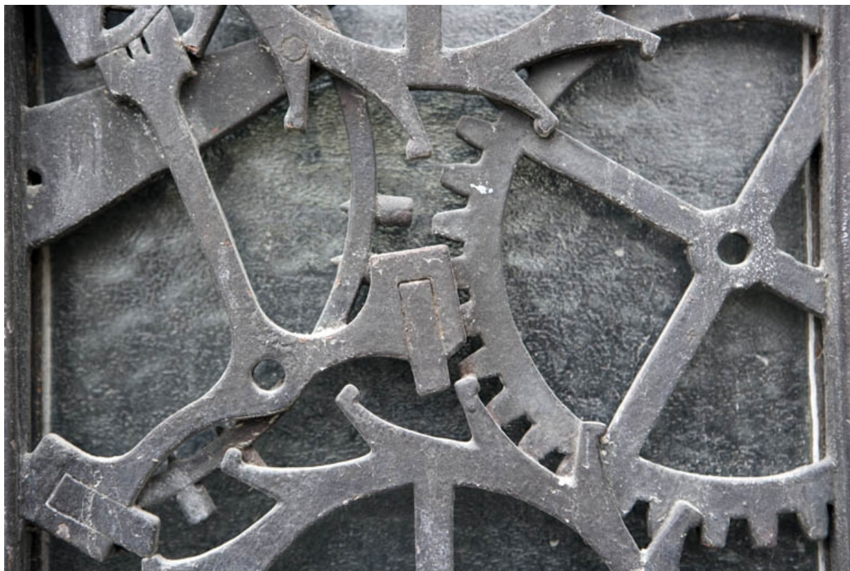
Motif d'ancres et balanciers de montre : détail.