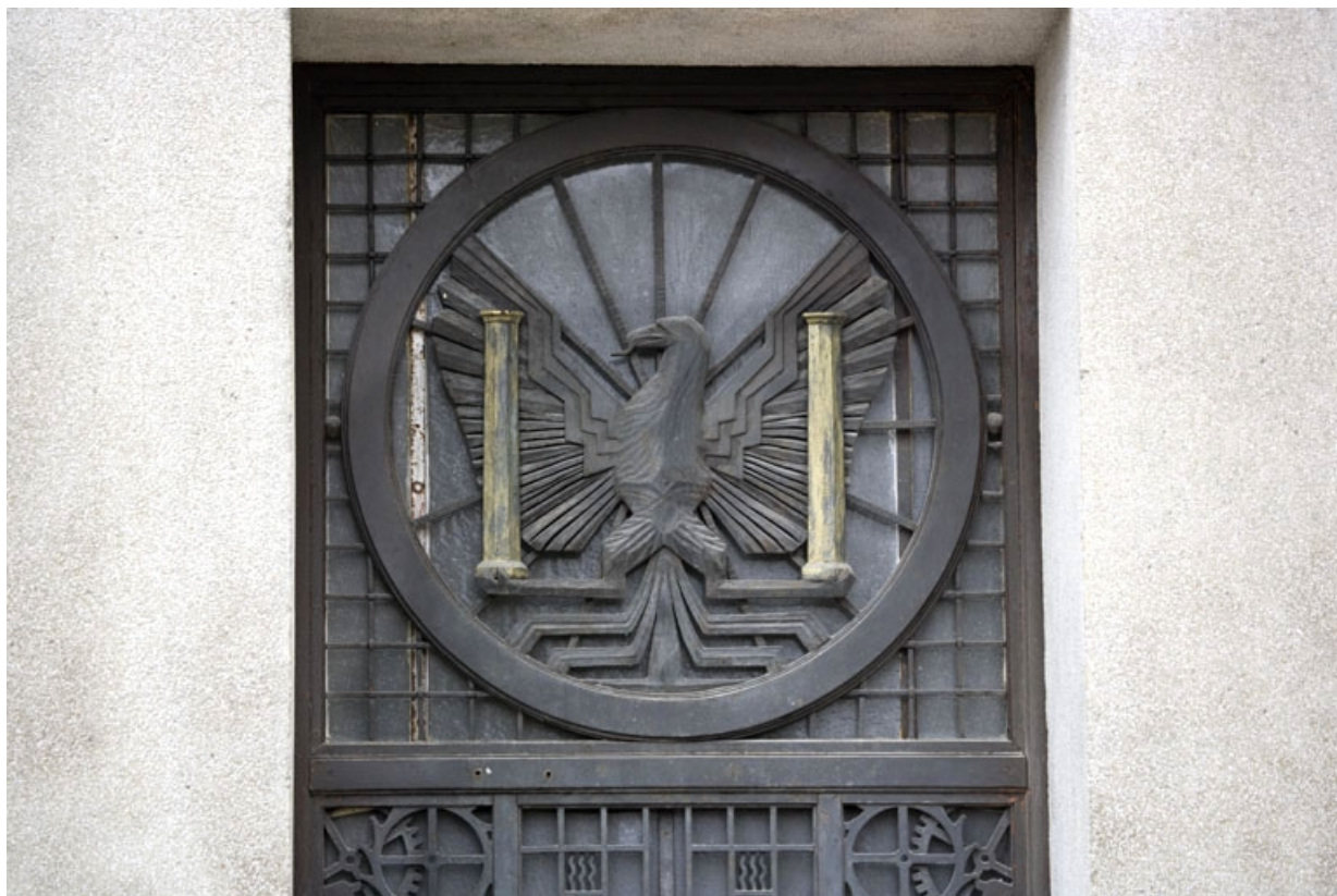
Porte latérale droite : armoiries de Besançon.