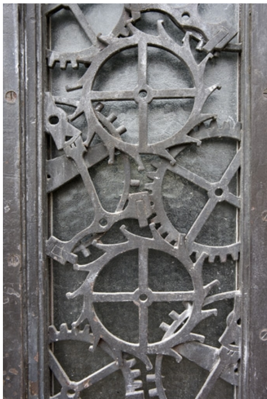
Motif d'ancres et balanciers de montre.