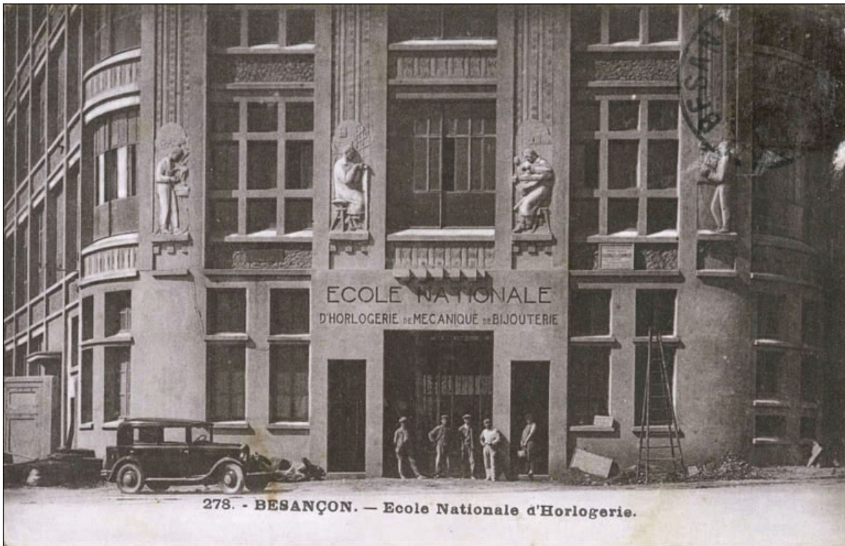
Besançon. - Ecole Nationale d'Horlogerie [l'entrée, avec des ouvriers], 1931 ou 1932. 25, Besançon, 1 rue Labbé