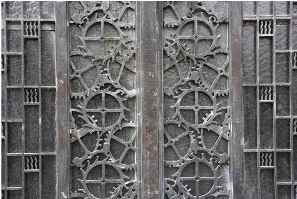
Porte centrale : motifs décoratifs à la jonction des vantaux (détail).