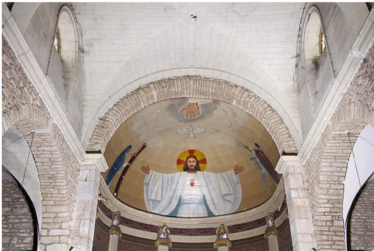
Vue rapprochée u chœur.