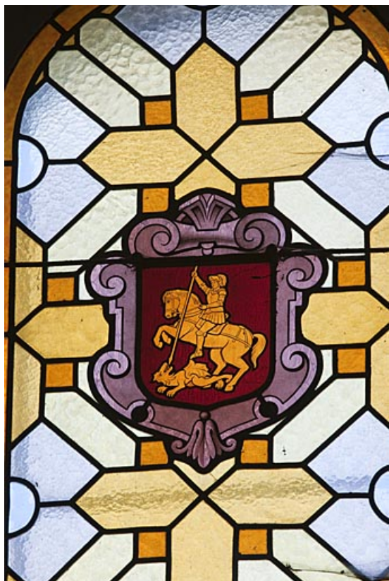
Verrière héraldique de la confrérie de saint Georges. 25, Rougemont quartier de la Citadelle