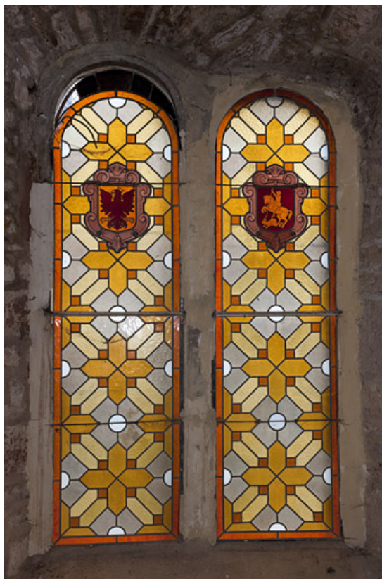
Vue générale des verrières héraldiques : armoiries de la famille de Rougemont et de la confrérie de saint Georges. 25, Rougemont quartier de la Citadelle