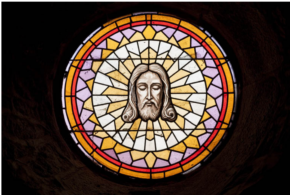
Verrière fermant l'oculus : tête de Christ.