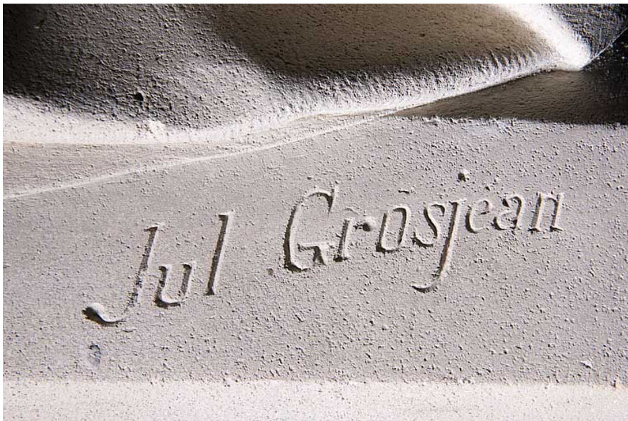
Détail : signature de Jules-Aimé Grosjean.