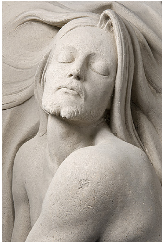
Détail : le visage, vue de face.