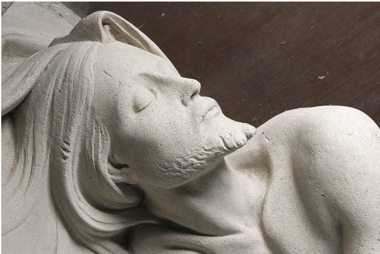
Détail : le visage, vue de profil.