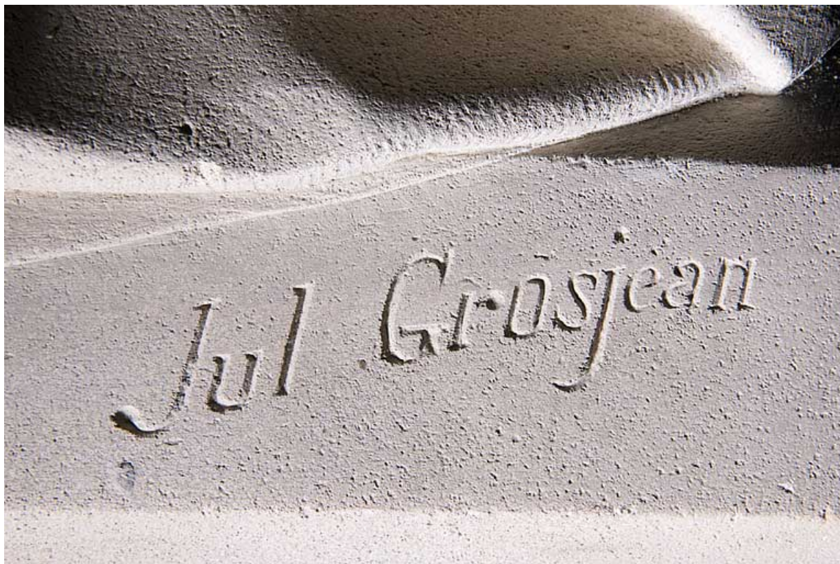
Détail : signature de Jules-Aimé Grosjean.