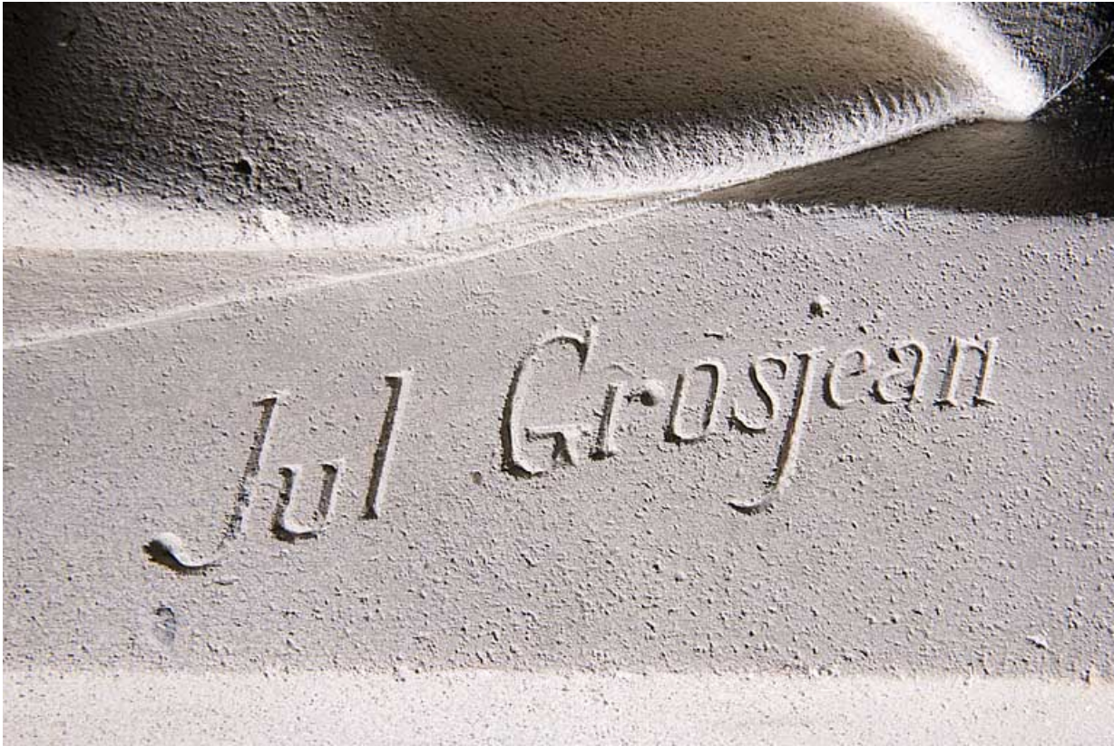
Détail : signature de Jules-Aimé Grosjean.