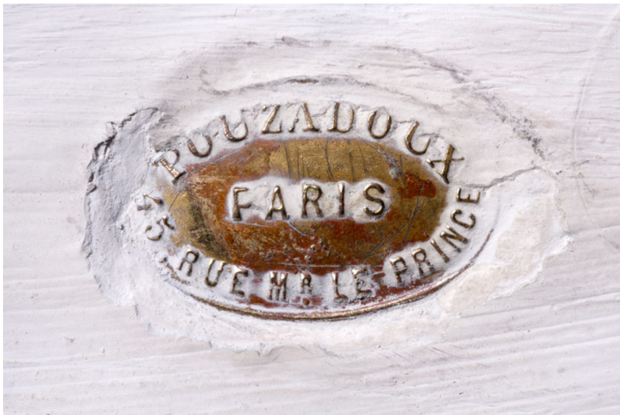
Détail : marque d'atelier (Pouzadoux de Paris).