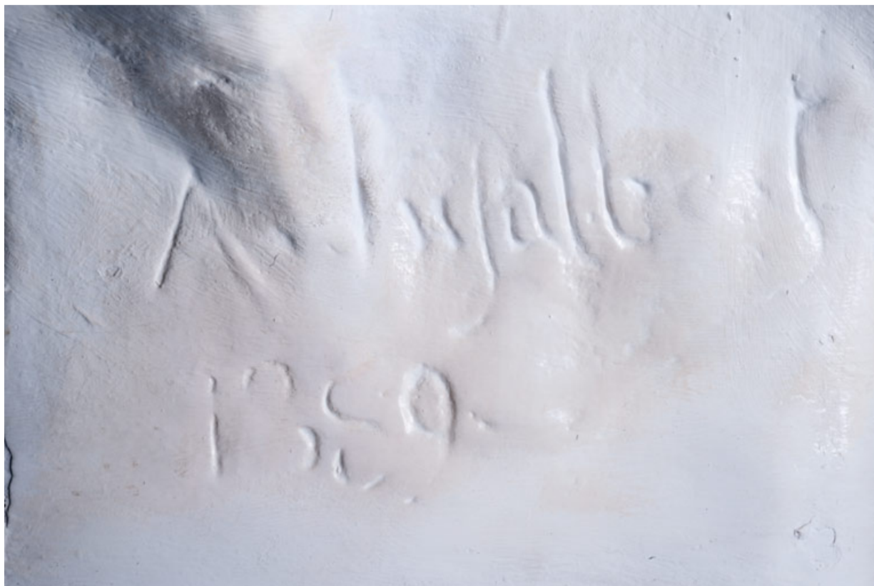
Détail : signature du sculpteur (A. Injalbert) et date (1889).