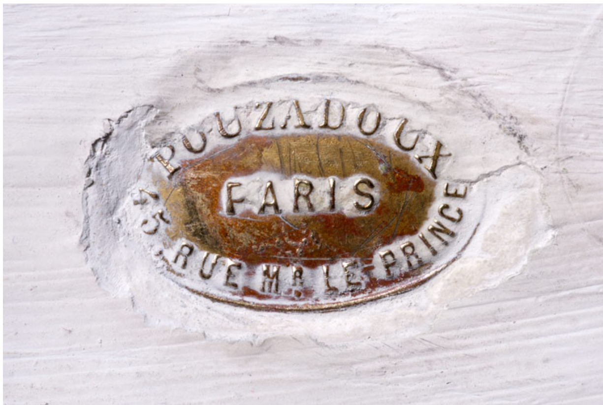
Détail : marque d'atelier (Pouzadoux de Paris).