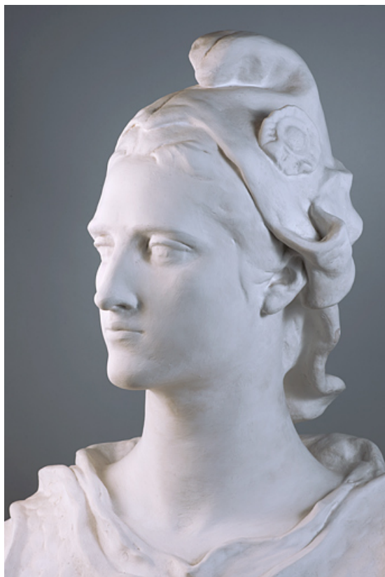
Vue de trois quart gauche.