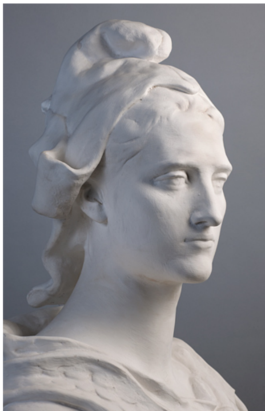
Vue de trois quart droit.