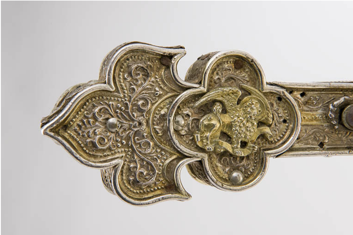
Détail : quadrilobe de saint Marc.