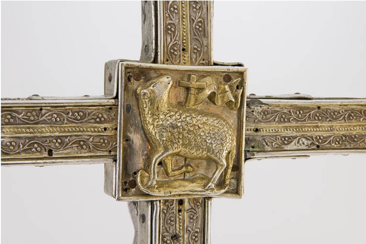
Détail : Agnus Dei, au revers.