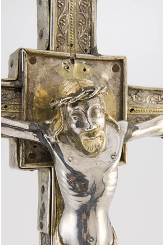
Détail : Christ à mi-corps.