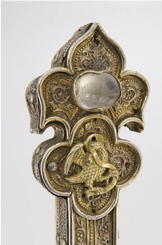
Détail : quadrilobe de saint Jean.