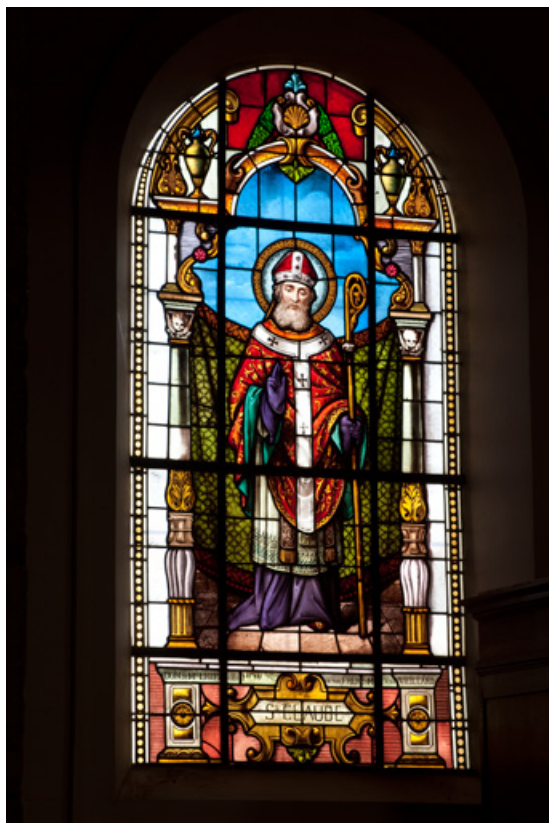
Verrière n°2 : saint Claude. Vue générale.