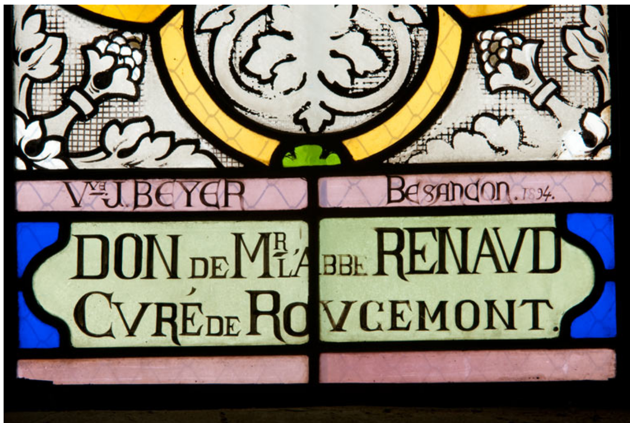
Verrière n° 3. Inscriptions concernant l'auteur et le donateur.