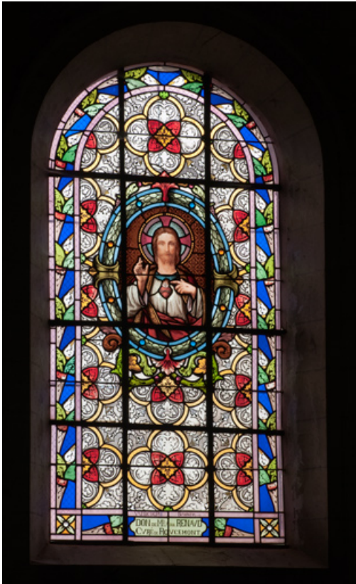
Verrière n°4 : sacré Cœur de Jésus. Vue générale. 25, Rougemont quartier de la Citadelle