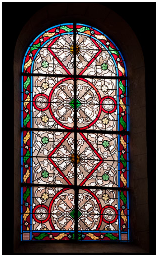
Verrière n° 5 : verrière décorative. Vue générale. 25, Rougemont quartier de la Citadelle