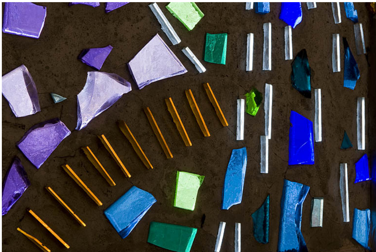
Détail du chemin menant à la croix. 25, Rougemont quartier de la Citadelle