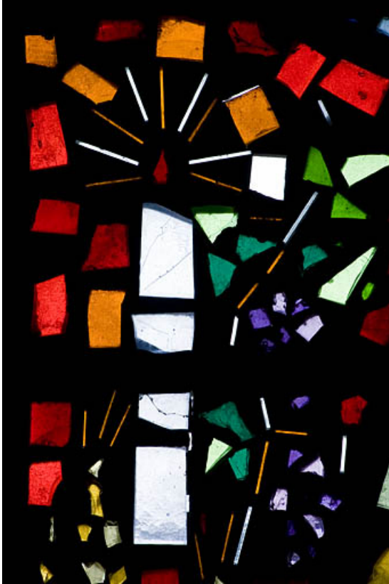
Détail : cierge et grappe de raisin.