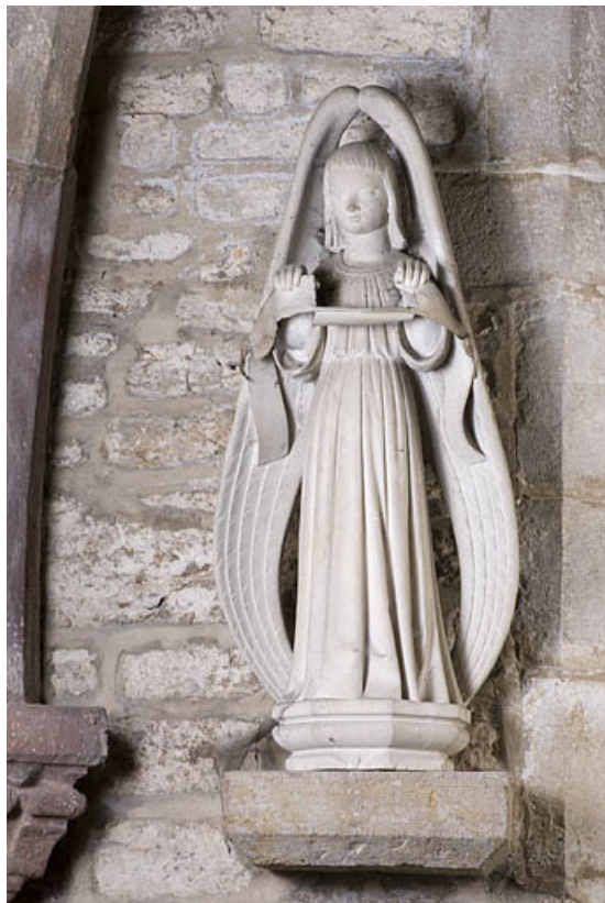
Anges en pendant tenant un phylactère : ange situé à droite. 25, Rougemont quartier de la Citadelle