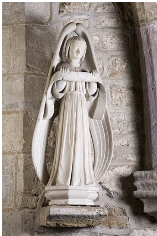
Anges en pendant tenant un phylactère : ange situé à gauche. 25, Rougemont quartier de la Citadelle