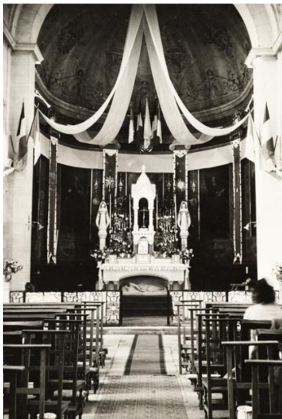
Vue d'ensemble du maître-autel, avant 1960. 25, Rougemont quartier de la Citadelle