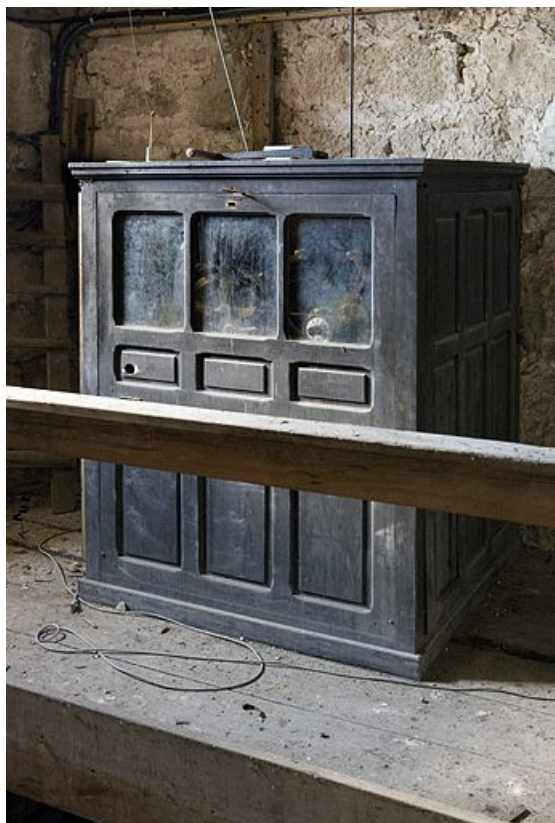
Vue générale rapprochée.