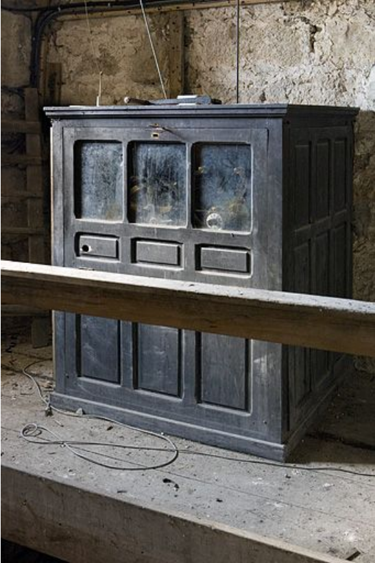
Vue générale rapprochée.