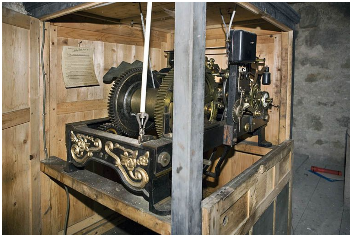
Vue d'ensemble du mécanisme.