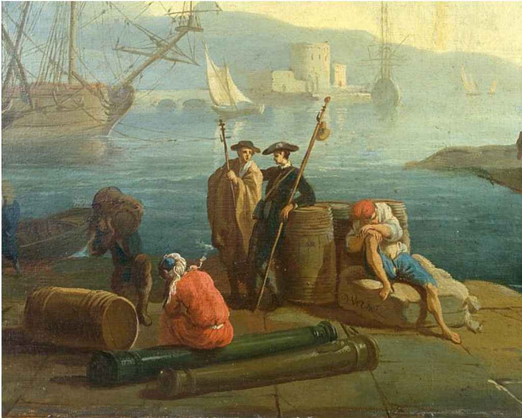
Détail : personnages et signature.