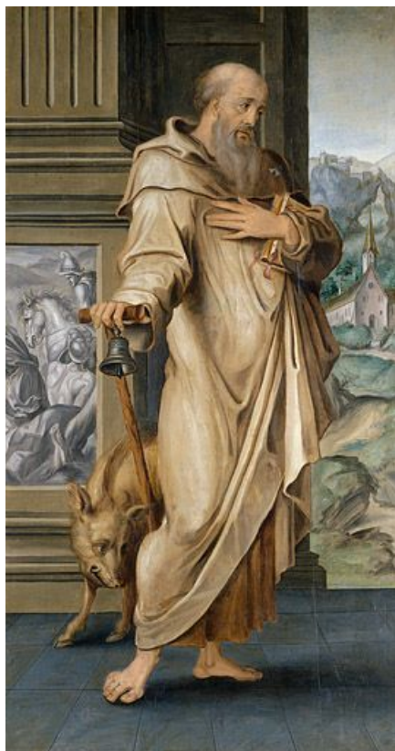
Volet gauche : saint Antoine.