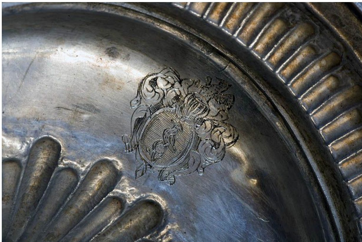
Détail, les armoiries.