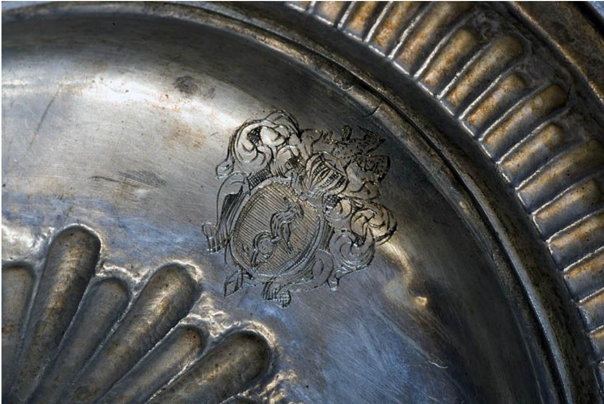
Détail, les armoiries. 25, Bonnevaux