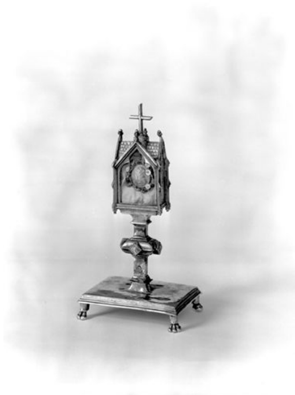
Face antérieure de trois quart droit.