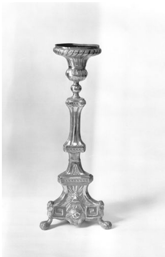
Vue générale d'un chandelier d'autel.