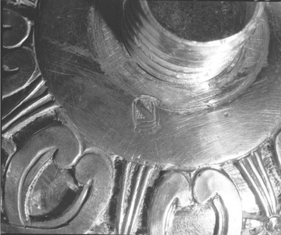
Détail, poinçon de la ville de Salins. 25, Vaux-et-Chantegrue