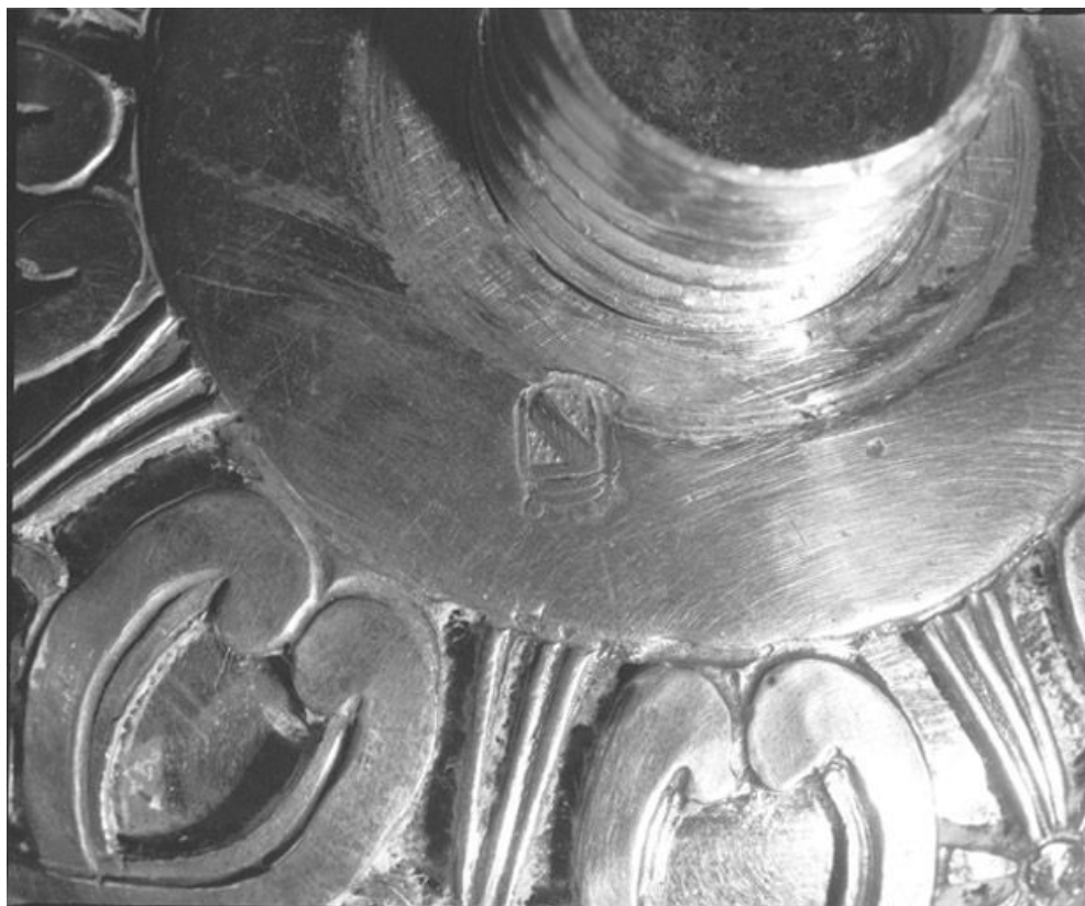
Détail, poinçon de la ville de Salins. 25, Vaux-et-Chantegrue