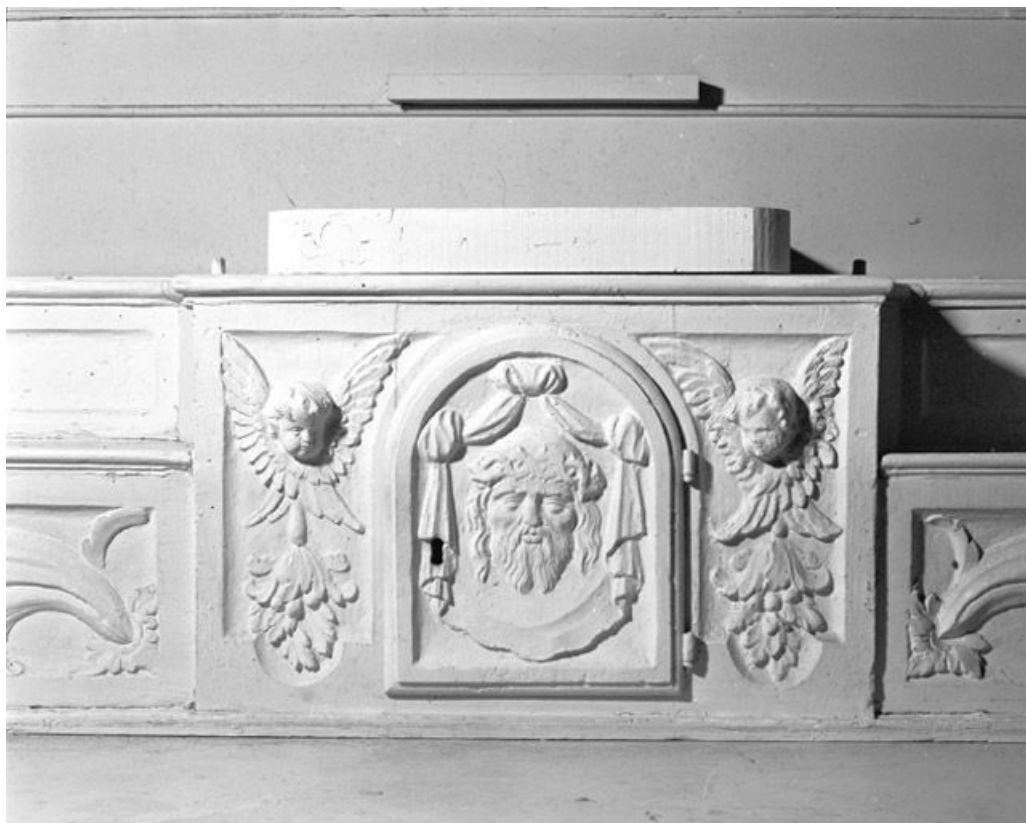
Porte du tabernacle.