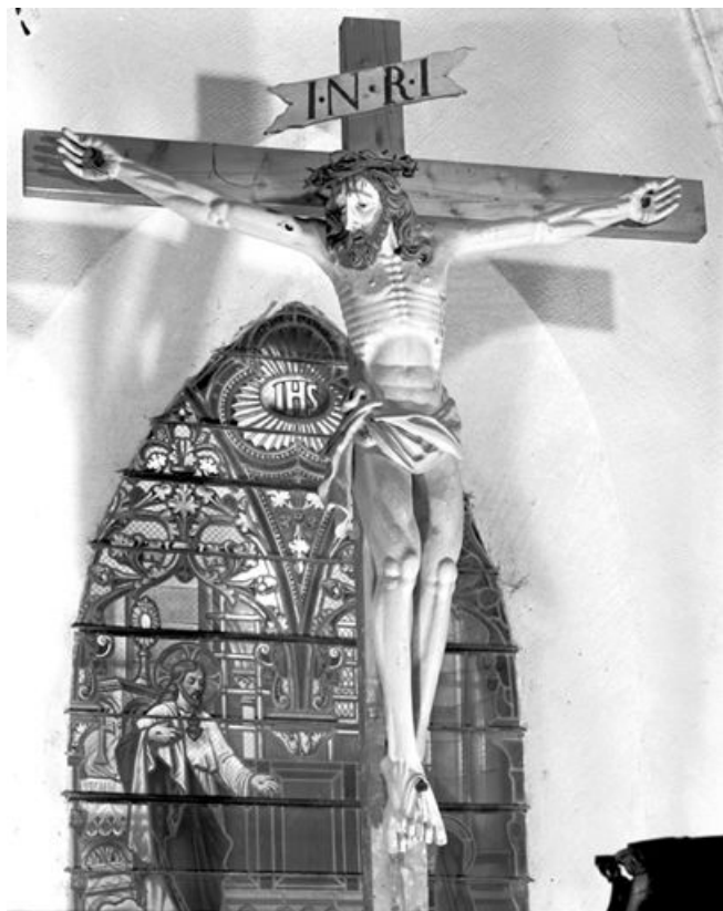
Vue générale. 25, Rochejean