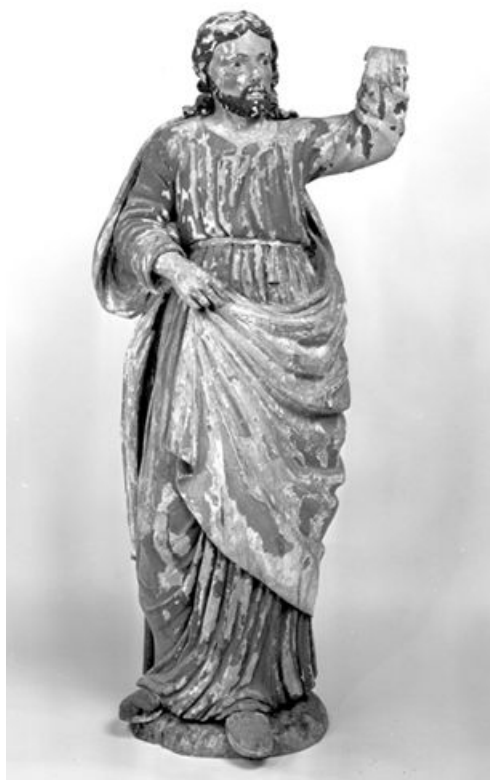
Saint (?). Vue de face. 25, Rochejean