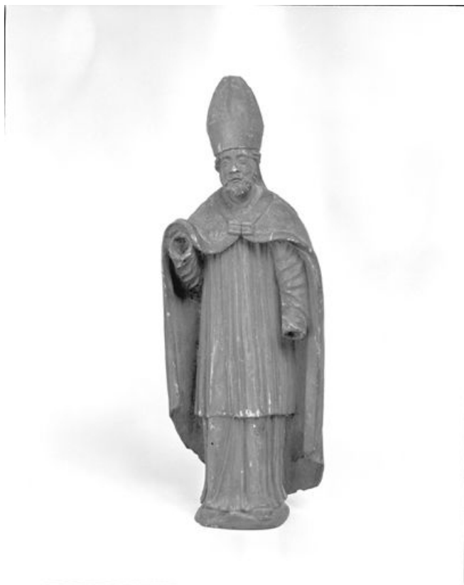
Saint Claude vu de face.