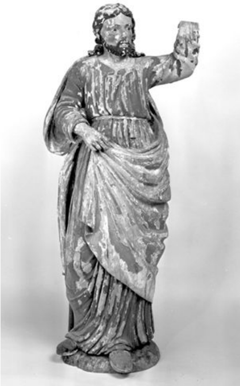
Saint (?). Vue de face.