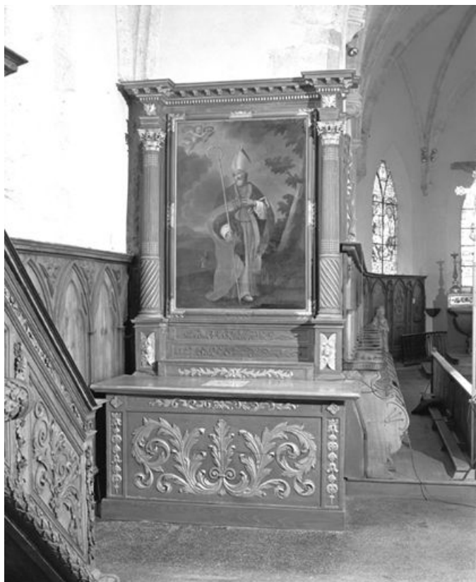
Vue d'ensemble de l'autel secondaire nord. 25, Rochejean