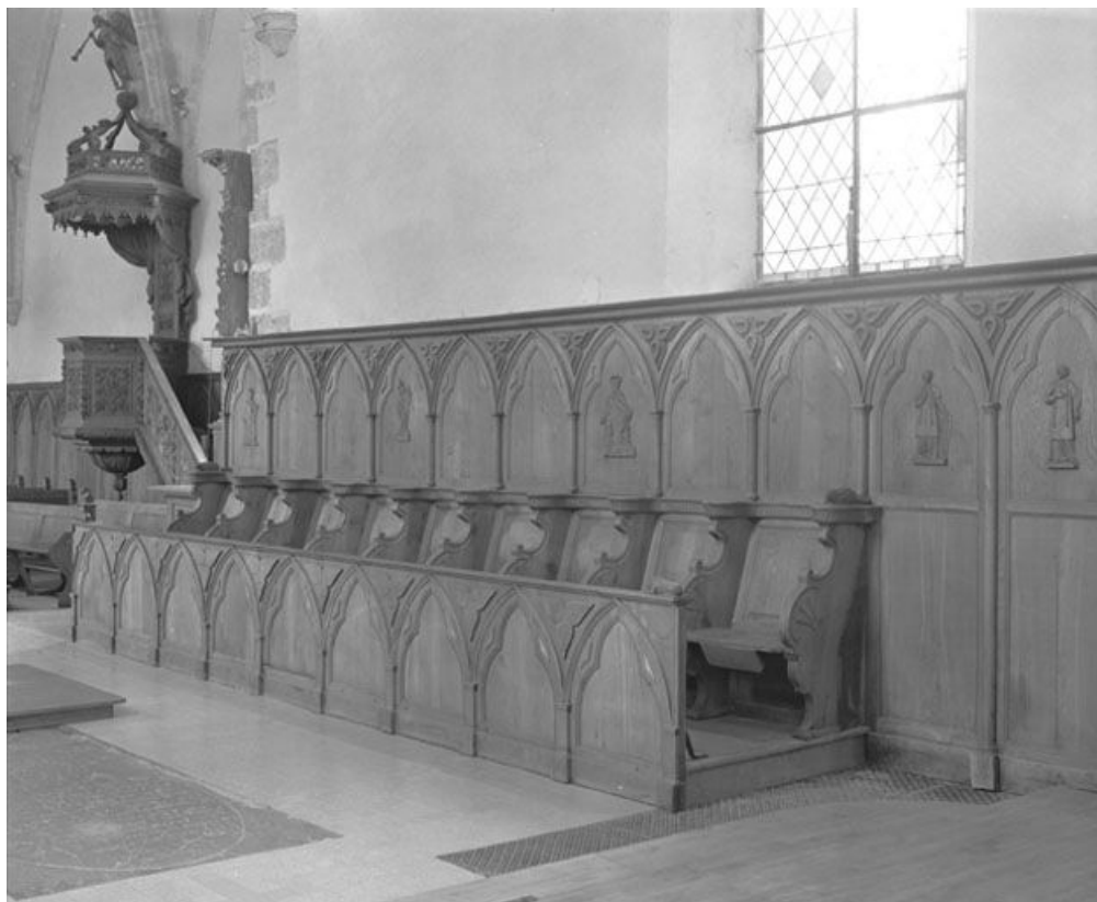
Vue générale. 25, Rochejean