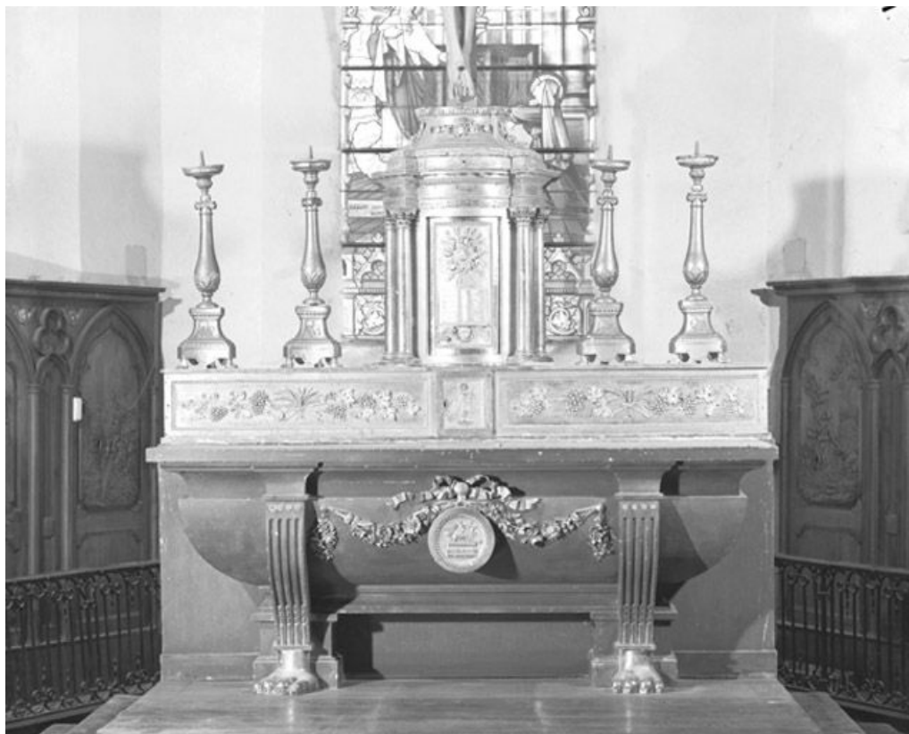
Vue d'ensemble. 25, Rochejean