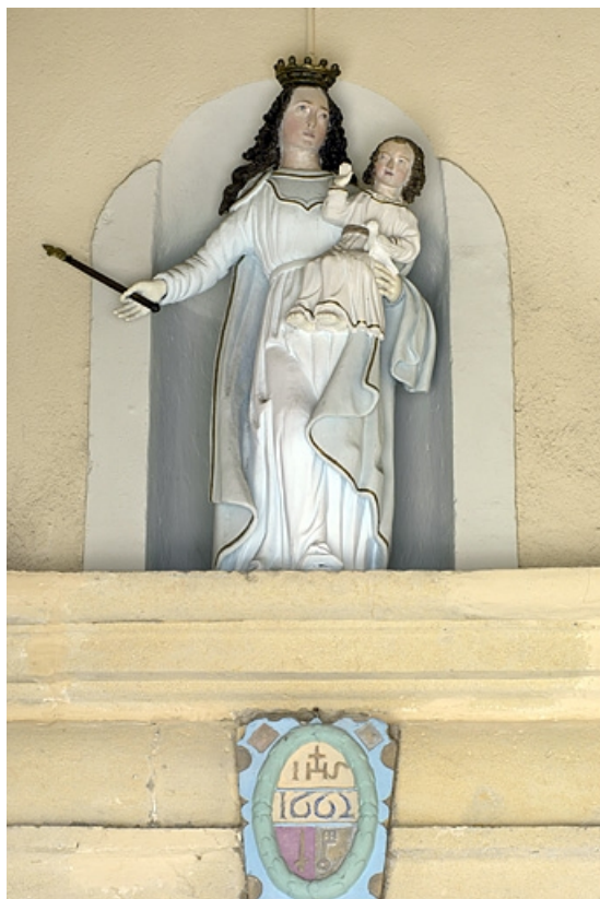
Vue de trois quarts droit en contre-plongée. 25, Jougne