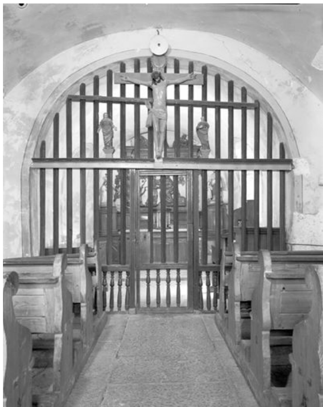
Vue générale. 25, Le Crouzet