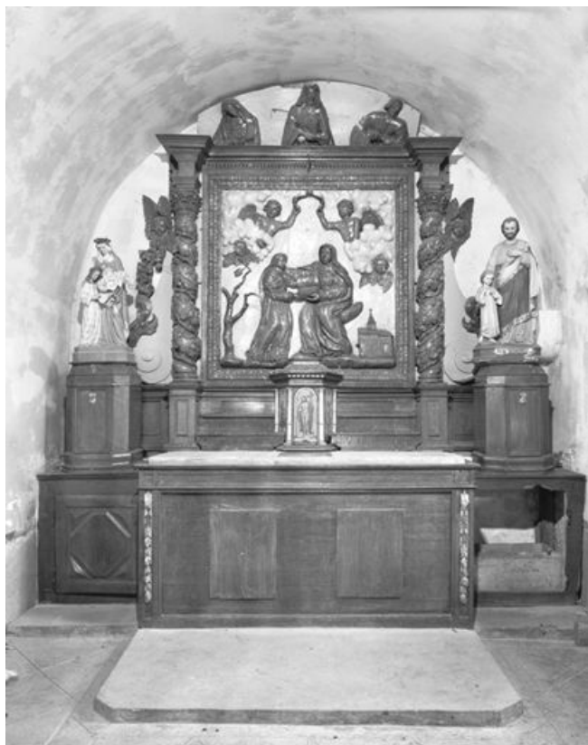
Vue générale. 25, Le Cruzet