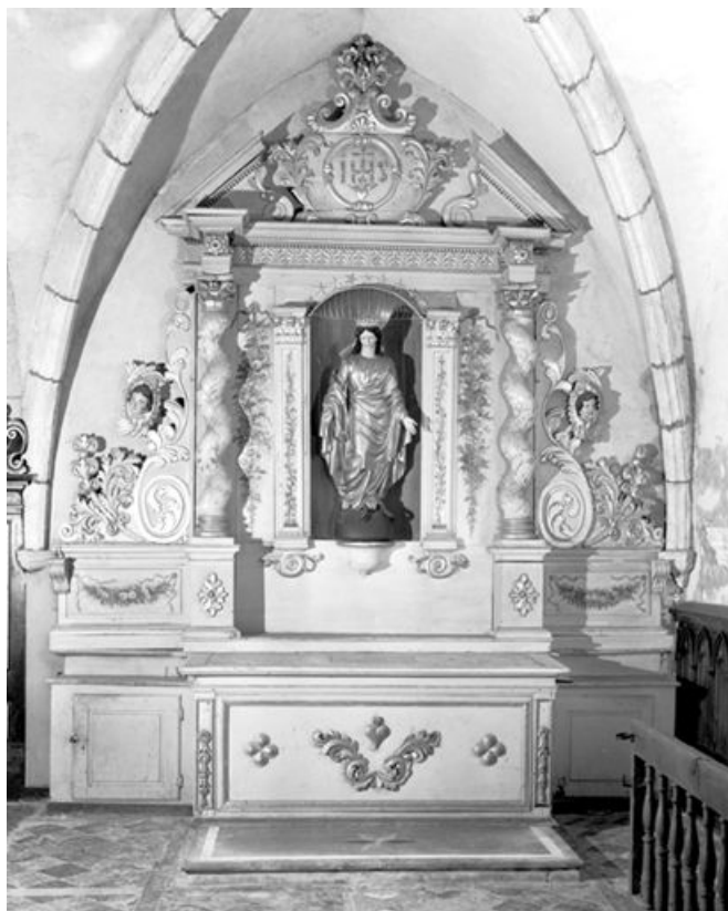
Vue d'ensemble. 25, Chaux-Neuve