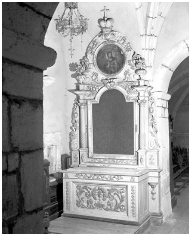
Vue d'ensemble. 25, Chaux-Neuve