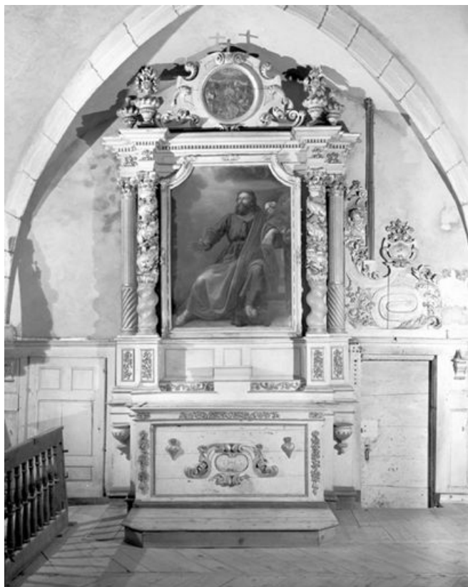
Vue d'ensemble. 25, Chaux-Neuve