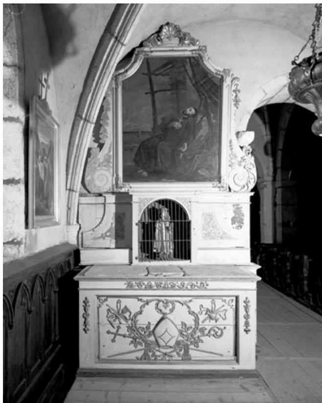
Vue d'ensemble. 25, Chaux-Neuve