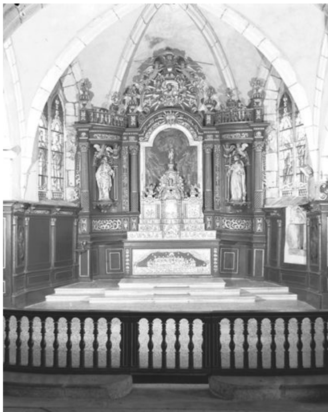
Vue d'ensemble. 25, Chaux-Neuve