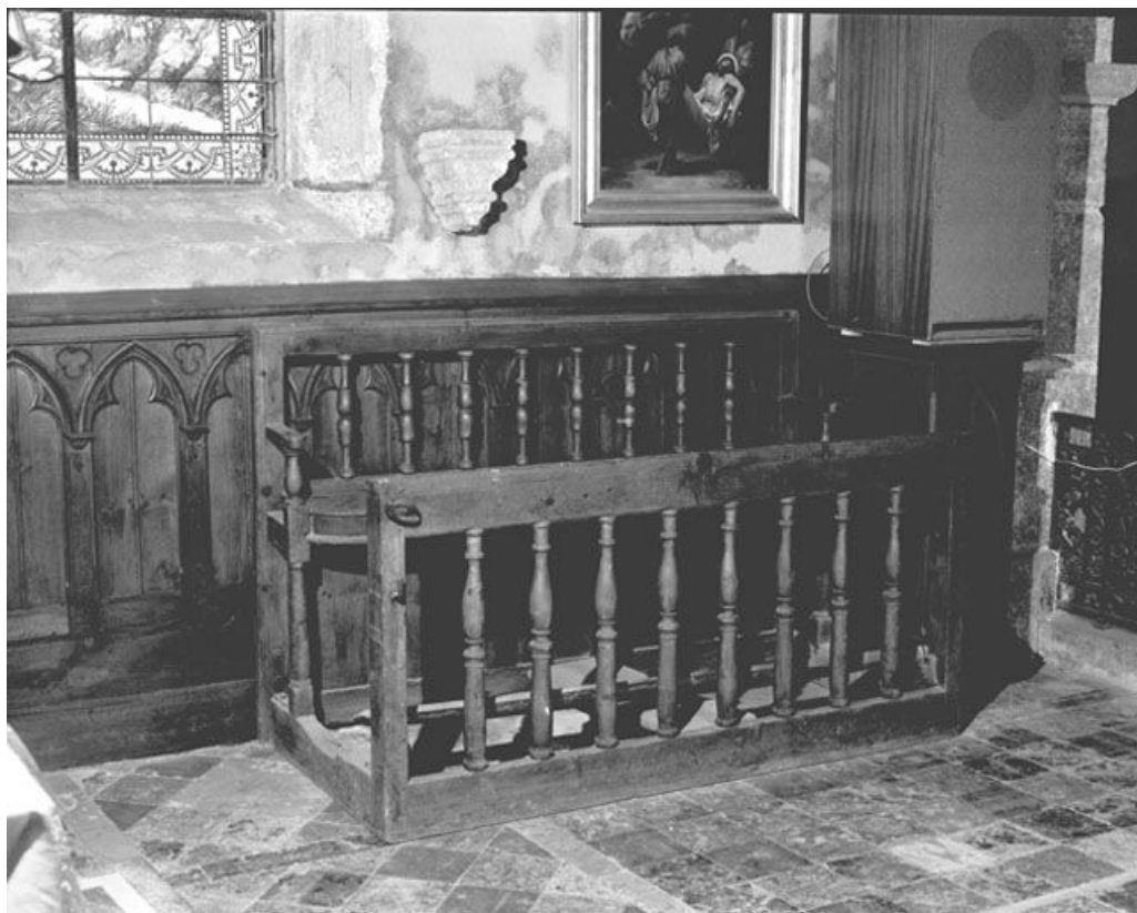
Vue d'ensemble. 25, Chaux-Neuve