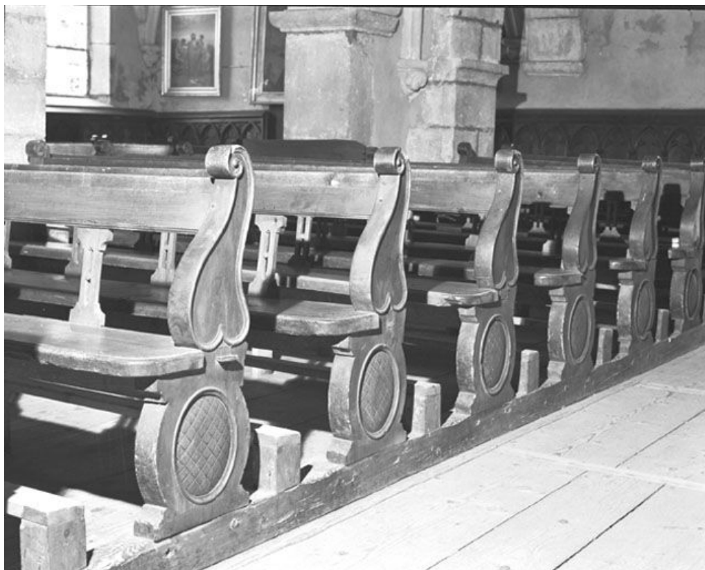
Vue d'ensemble. 25, Chaux-Neuve