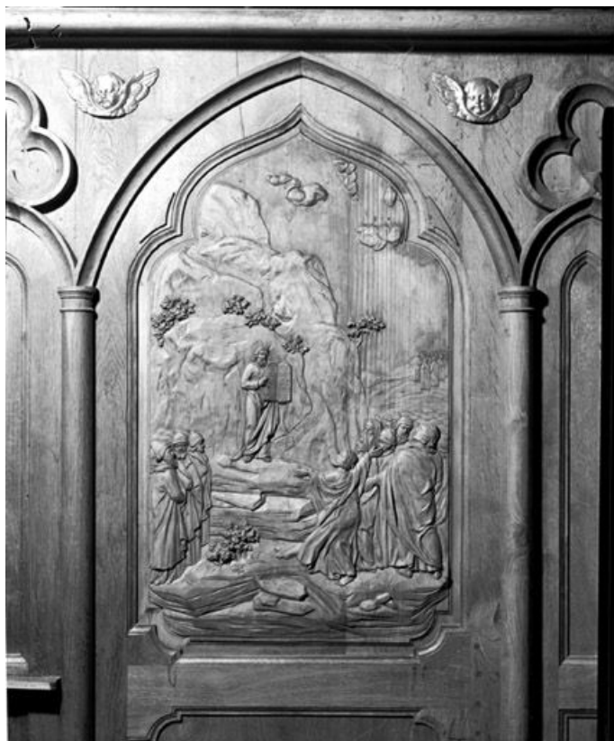
Bas-relief : Moïse. 25, Rochejean