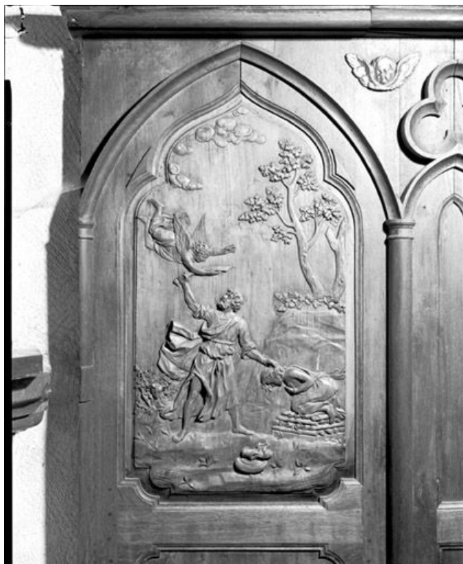
Bas-relief : le Sacrifice d'Abraham.