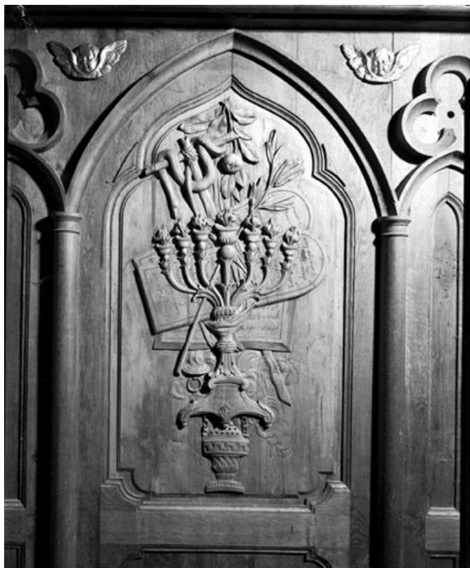
Bas-relief : Objets bibliques.