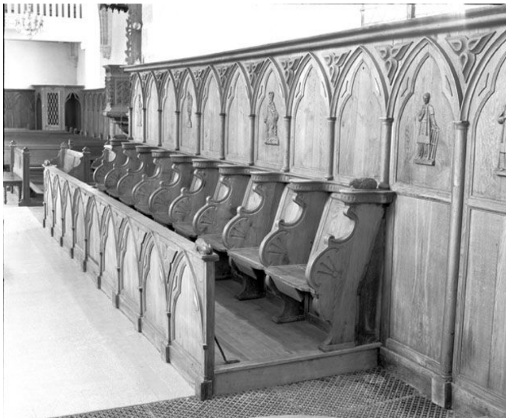
Vue générale rapprochée. 25, Rochejean