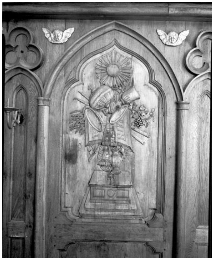
Bas-relief : l'Eucharistie.