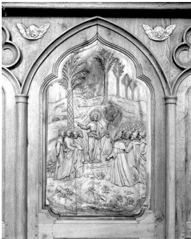
Bas-relief : le Sermon sur la montagne. 25, Rochejean