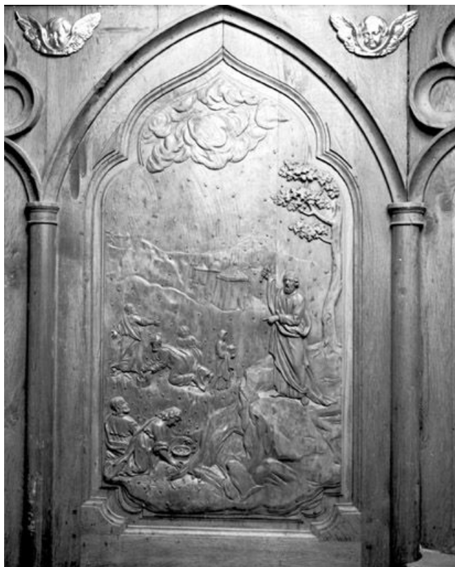
Bas-relief : la Manne. 25, Rochejean