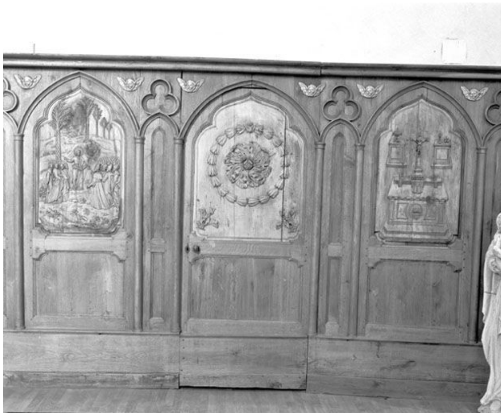
Vue de trois bas-reliefs : le Sermon sur la montagne, rosace et autel et objets liturgiques servant à la messe. 25, Rochejean