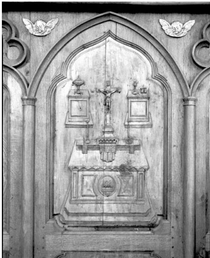
Bas-relief : autel et objets liturgiques servant à la messe. 25, Rochejean