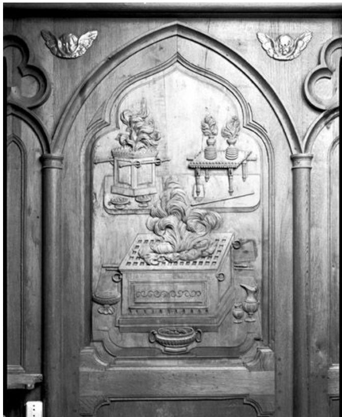
Bas-relief : mobilier et objets du culte juif. 25, Rochejean