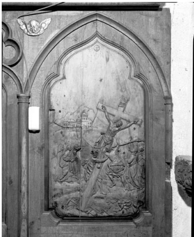
Bas-relief : l'Elévation de la croix.