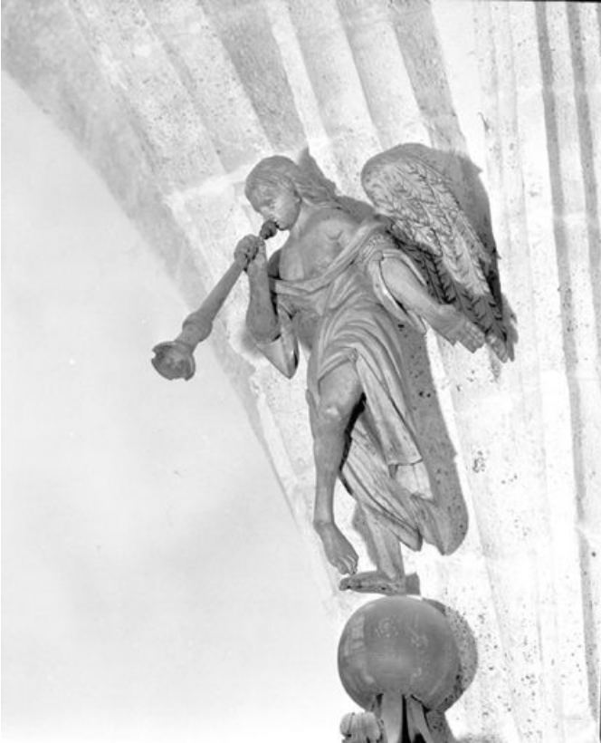
Détail, ange au sommet de l'abat-voix.