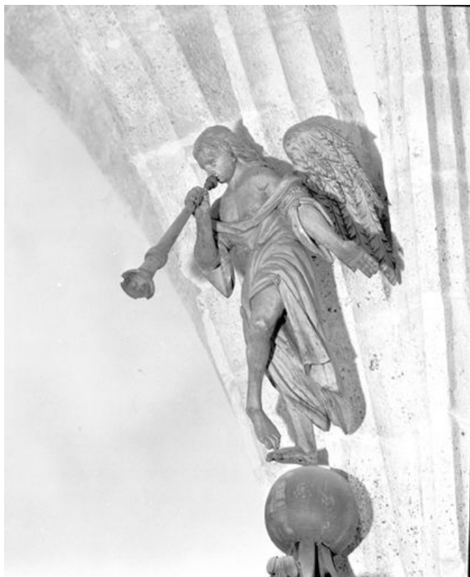
Détail, ange au sommet de l'abat-voix. 25, Rochejean