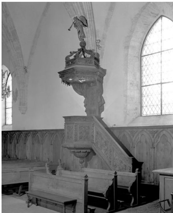
Vue d'ensemble. 25, Rochejean