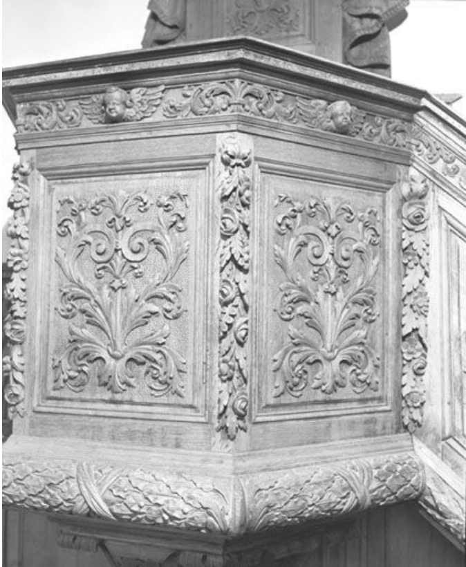
Panneaux de la cuve.