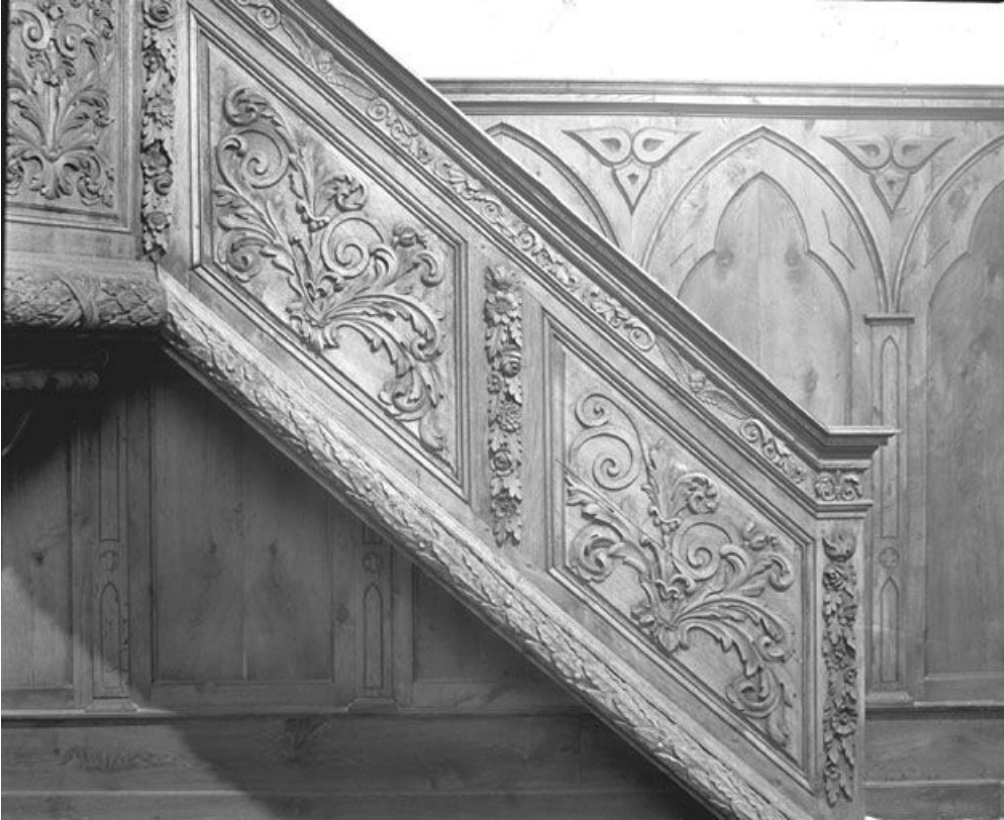
Panneaux de la rampe.