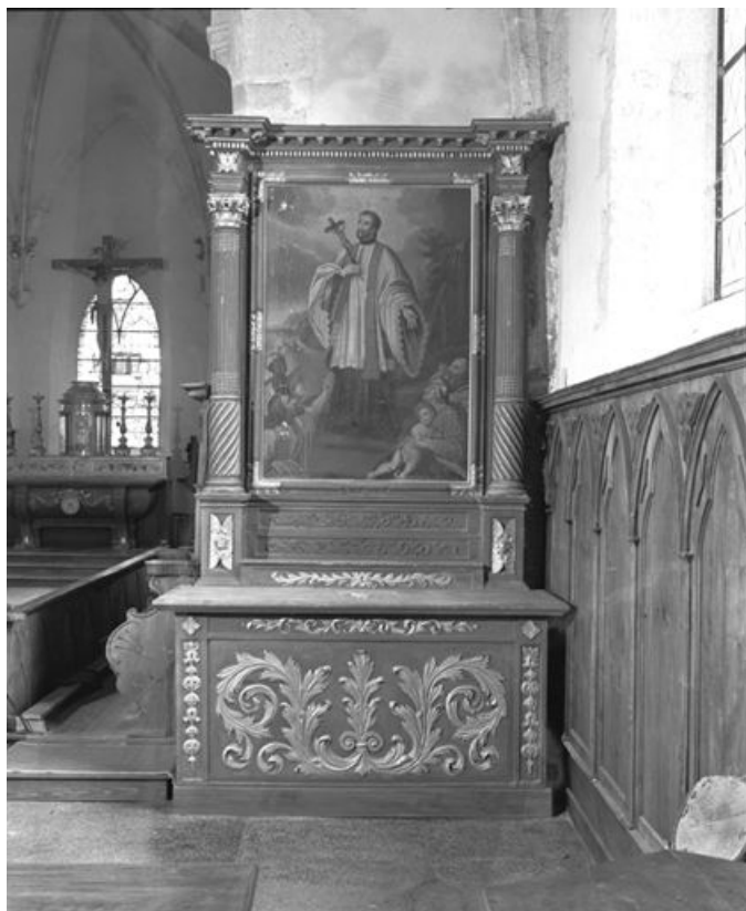
Vue d'ensemble de l'autel secondaire sud. 25, Rochejean