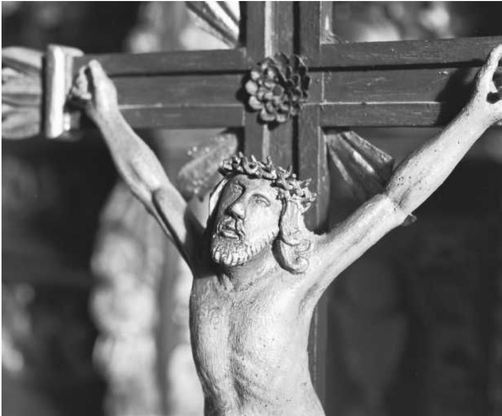
Détail : buste du Christ. 25, Saint-Antoine