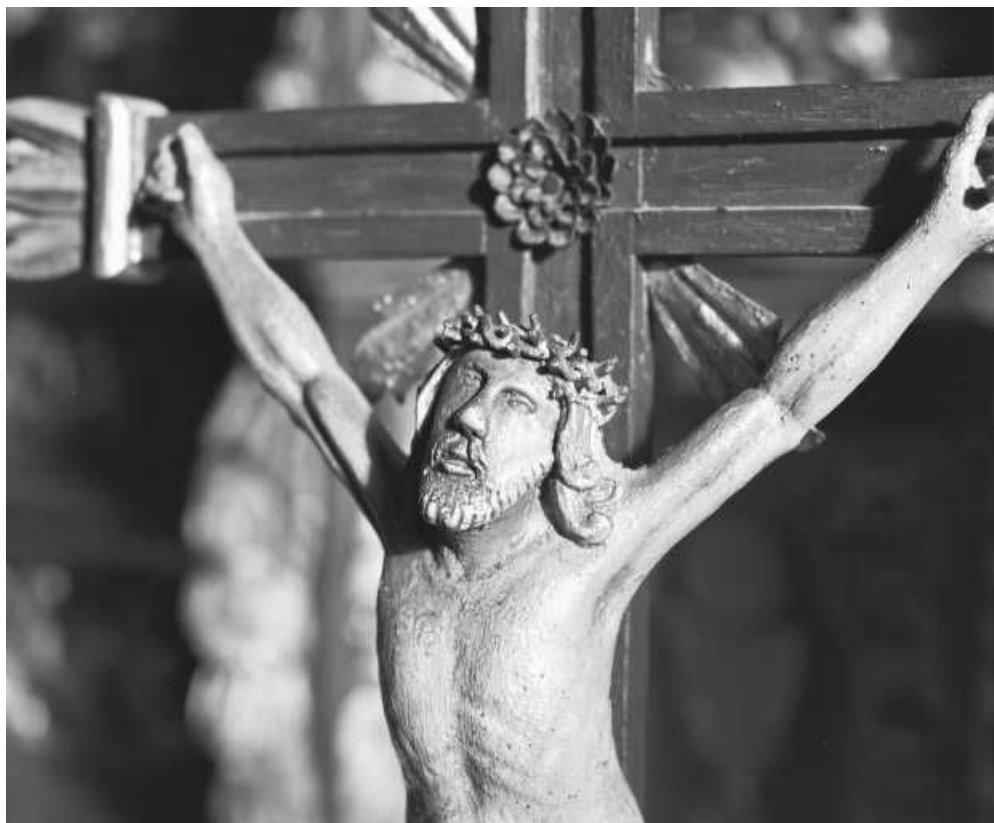
Détail : buste du Christ. 25, Saint-Antoine