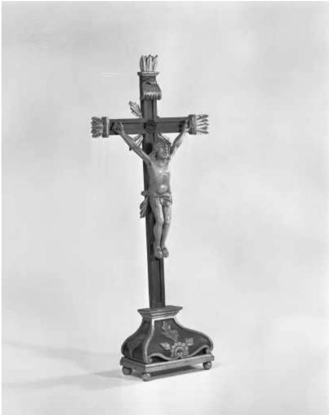
Vue de trois quarts droit.