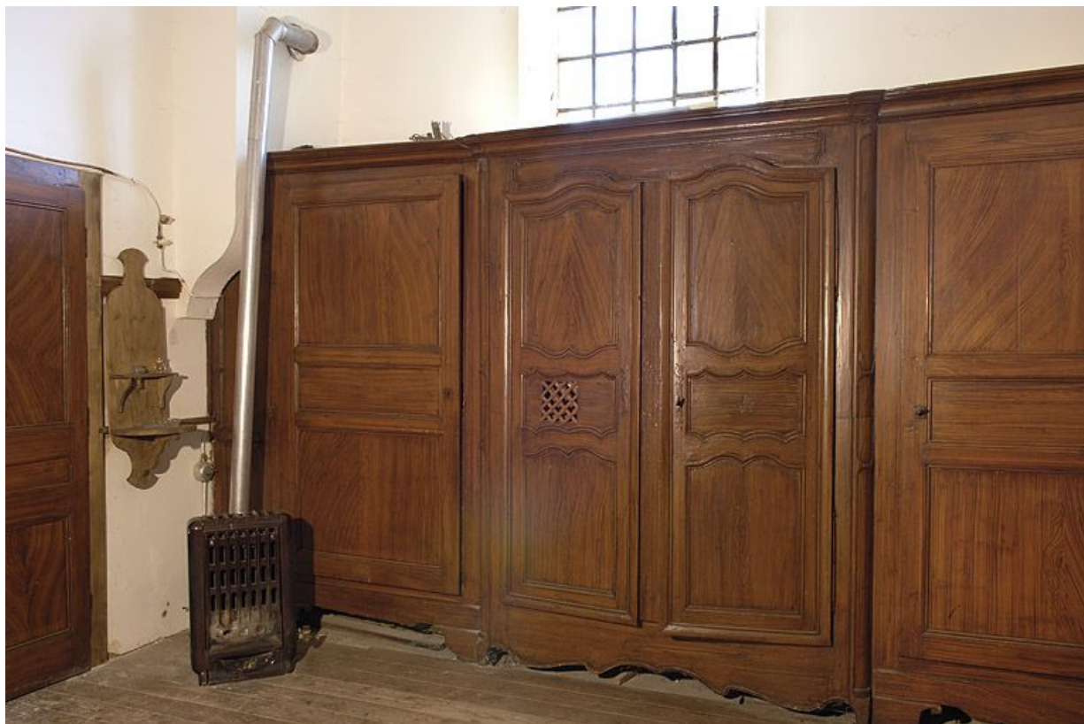
Les placards et le confessionnal à gauche de l'entrée. 25, Les Pontets