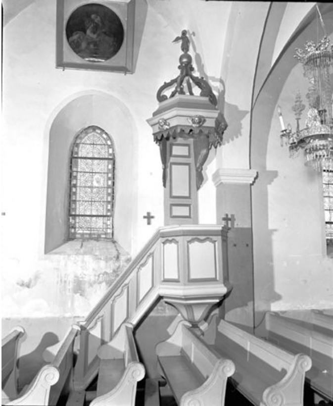
Vue générale. 25, Sarrageois