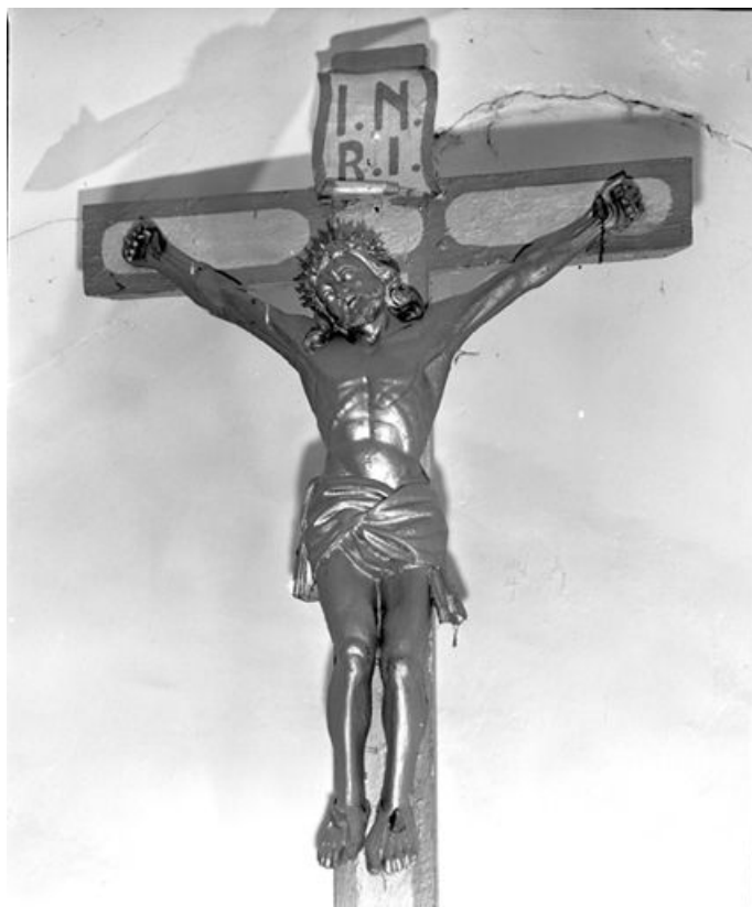
Vue générale. 25, Sarrageois