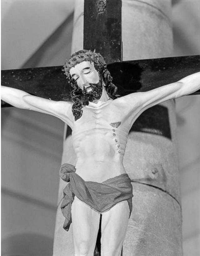
Détail : buste du Christ.