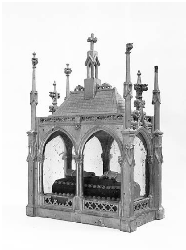
Vue de trois quarts droit d'une des châsses.