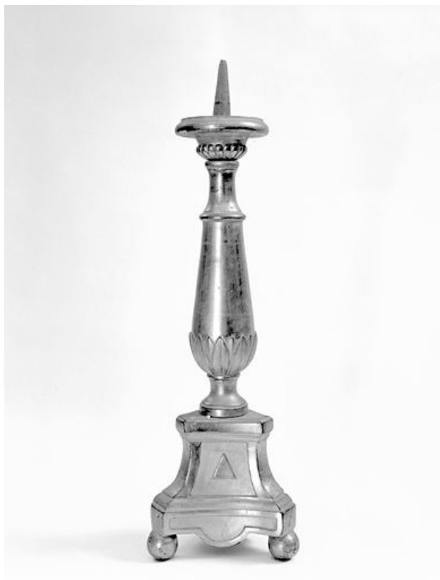
Vue générale d'un chandelier d'autel.