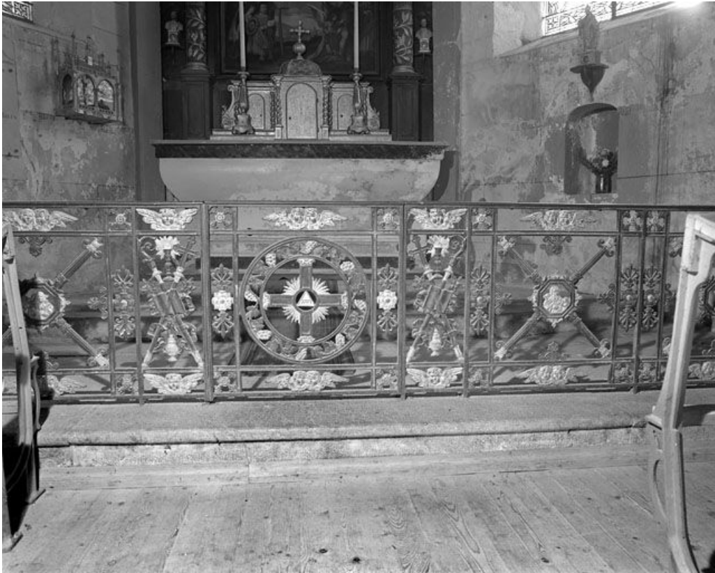
Le portillon central.