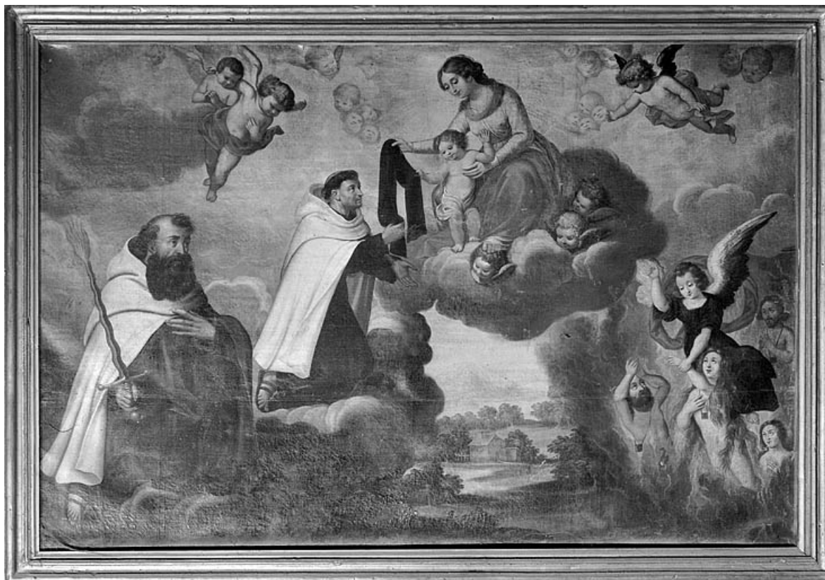
Vue générale. 25, Mouthe