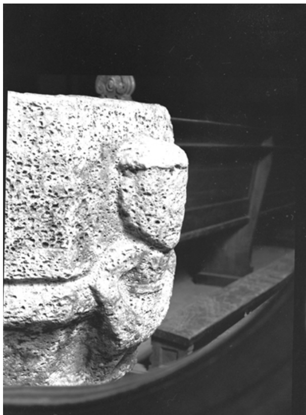
Détail, décor de la cuve.