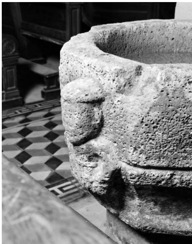
Détail, décor de la cuve. 25, Mouthe