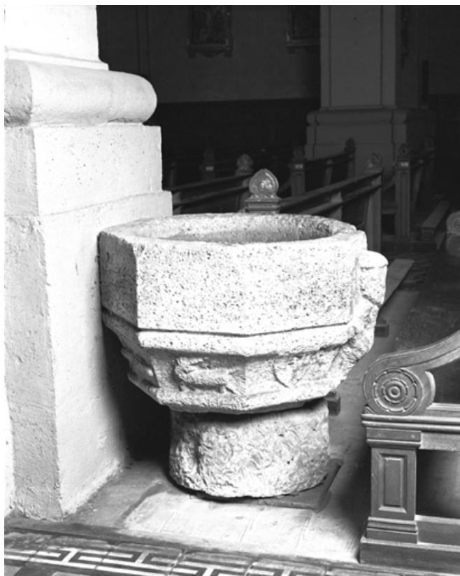
Vue générale. 25, Mouthe