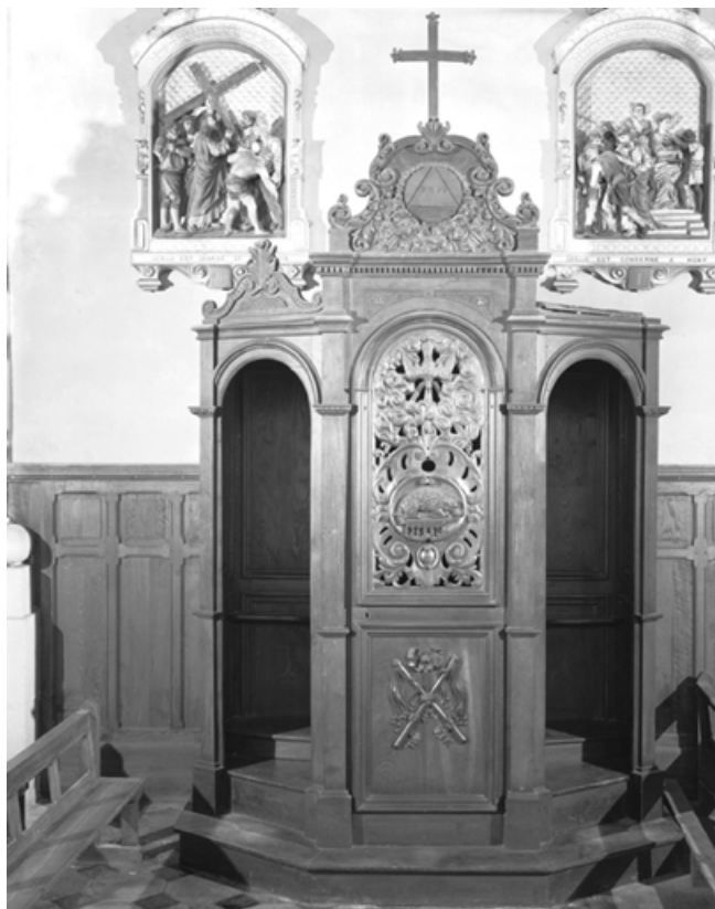
Vue de face. 25, Mouthe