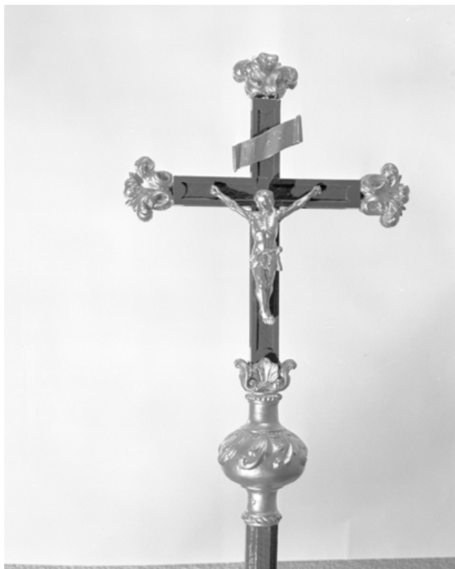
Vue générale d'une croix de procession. 25, Métabief