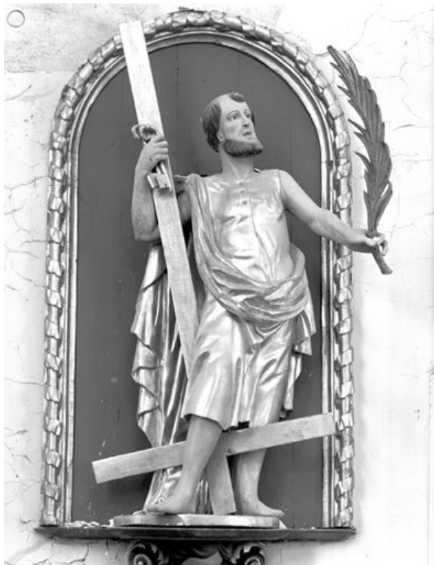
Saint Matthieu. 25, Métabief