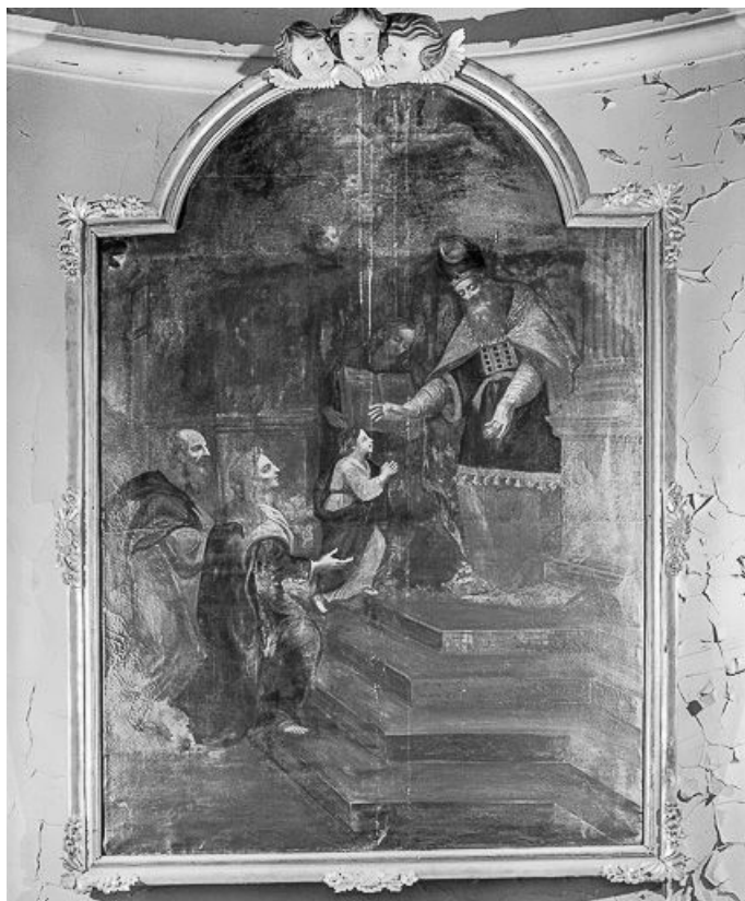
Vue générale. 25, Métabief