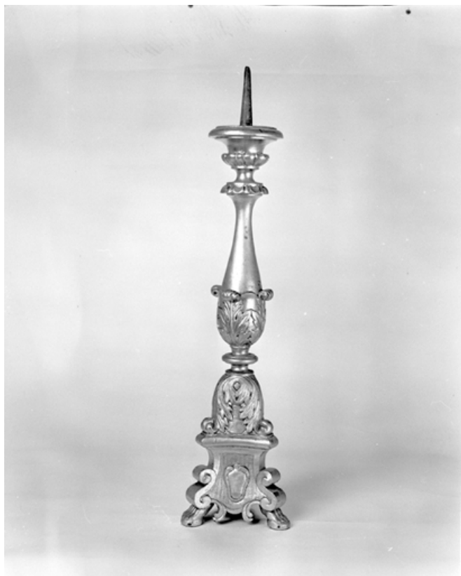
Vue d'un chandelier d'autel.