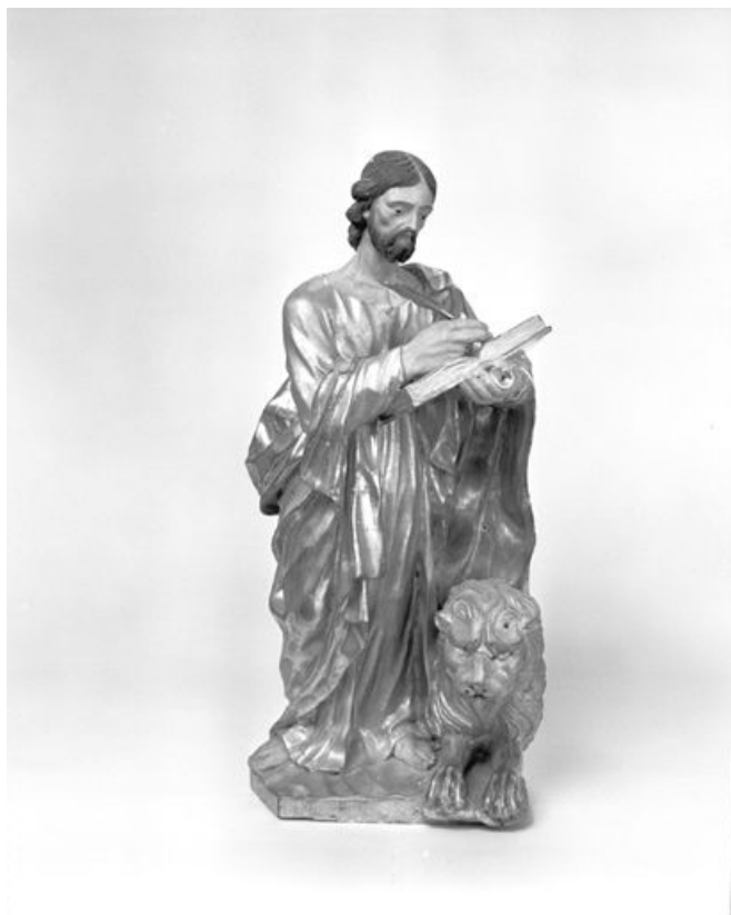
Saint Marc. 25, Métabief