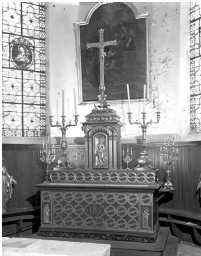
Vue d'ensemble. 25, Métabief