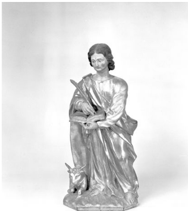
Saint Luc. 25, Métabief