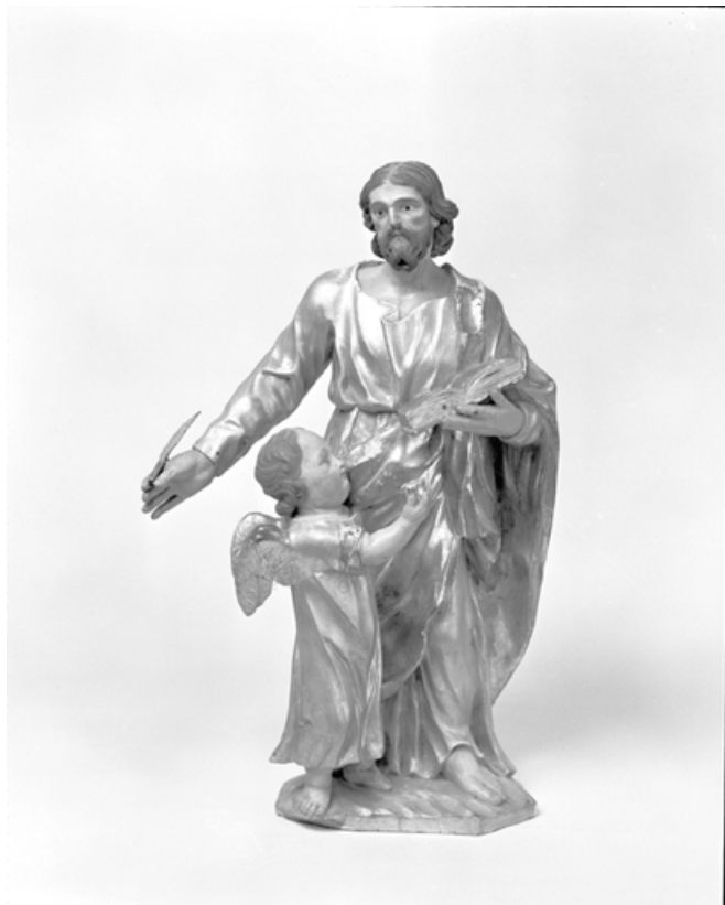
Saint Paul. 25, Métabief