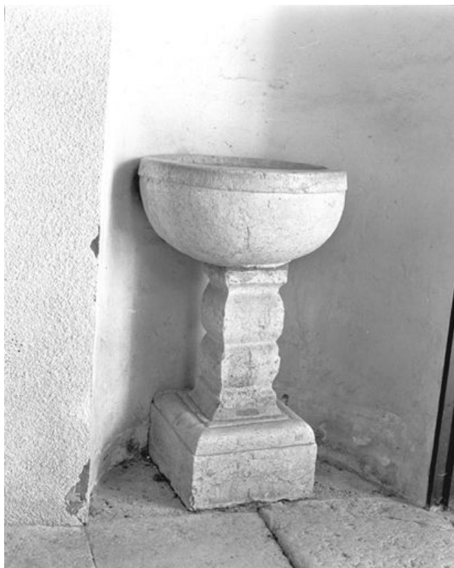
Vue d'ensemble. 25, Métabief