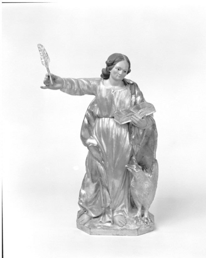
Saint Jean. 25, Métabief