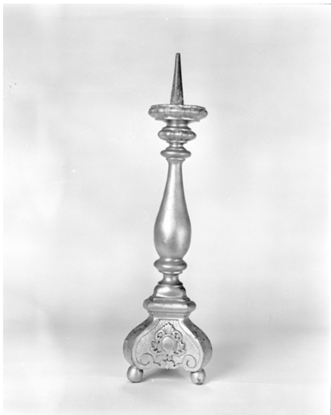
Vue d'un chandelier d'autel.