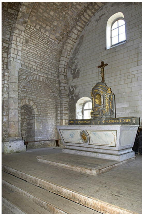
Vue générale de trois quarts gauche.