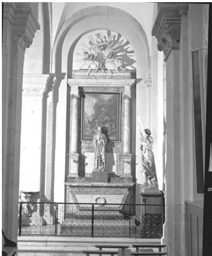
Autel secondaire sud. 25, Longevilles-Mont-d'Or