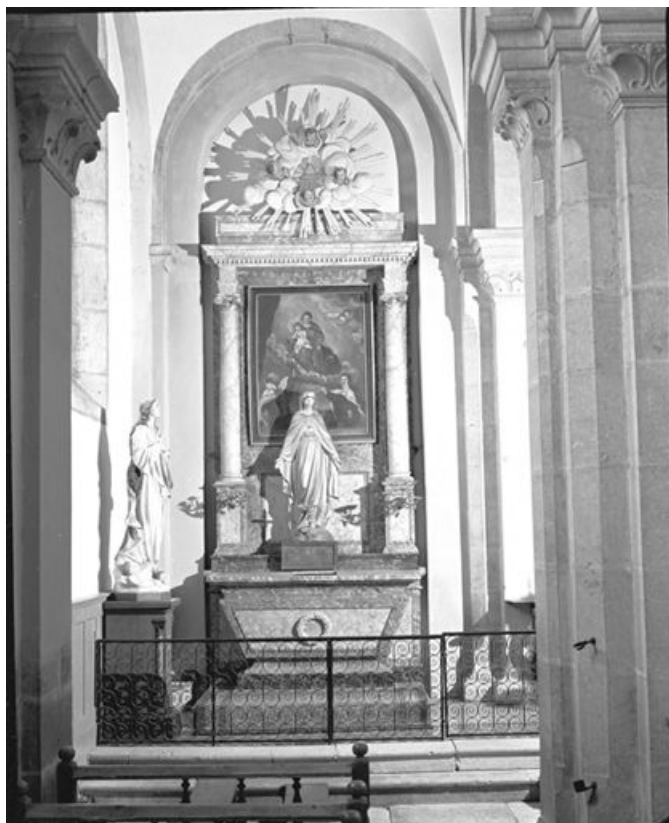
Autel secondaire nord. 25, Longevilles-Mont-d'Or