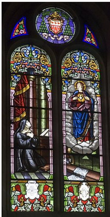
Baie 6 : Sainte Marie-Marguerite Alacoque. 25, Labergement-Sainte-Marie