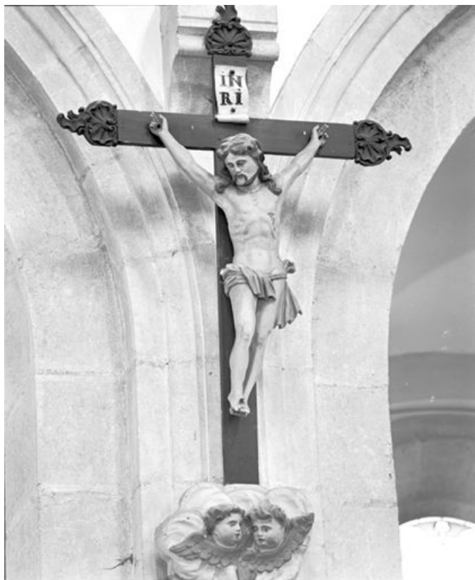
Vue générale de trois quarts gauche. 25, Longevilles-Mont-d'Or